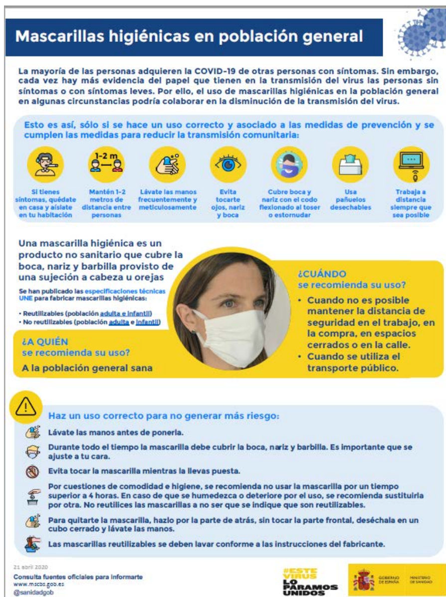
Mascarillas higiénicas en población general (Ministerio de Sanidad, 2020)

Nota: las mascarillas quirúrgicas y las mascarillas higiénicas no son consideradas EPI.