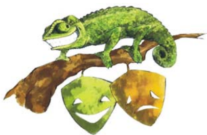
TEATRO EL LUGÁ