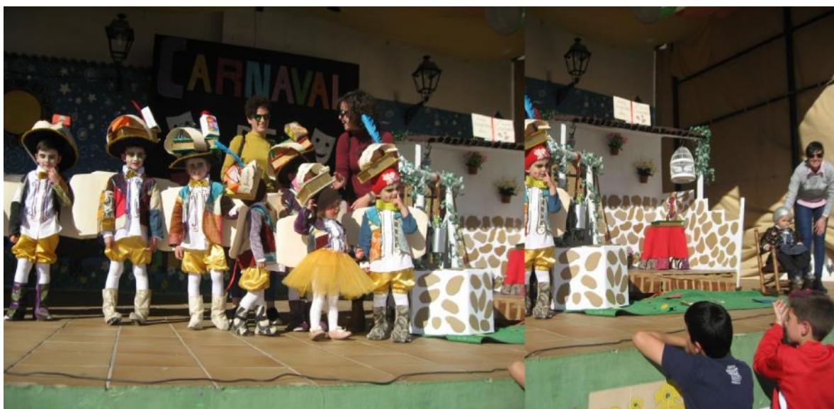
Grupo ganador del Concurso de disfraces de infantiles titulado: Los cuentos de María Castaña