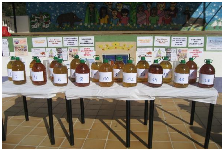
Presentación de las 18 garrafas de mosto presentadas al concurso