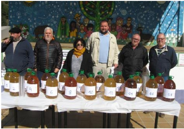
Componentes del jurado. Cata de Mosto 2018-2019