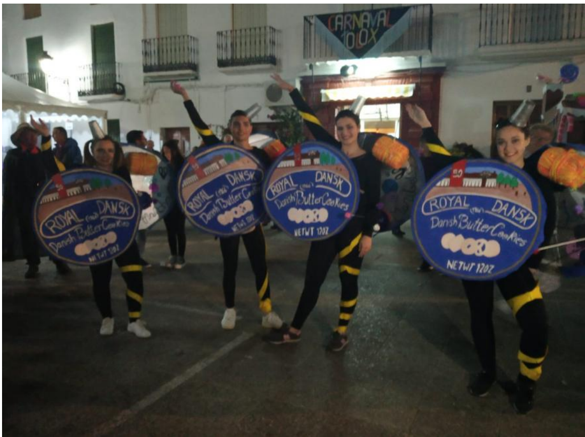
6º PREMIO DEL CARNAVAL DE TOLOX 2019, TITULADO "LAS COSTURERAS"