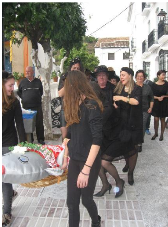
ENTIERRO DE LA SARDINA EL ÚLTIMO DÍA DE CARNAVAL

y ya solamente decir aquella coplilla del carnaval que nuestros antepasados cantaban y que hoy gracias a Dios se sigue cantando y que dure generaciones enteras para el bien de nuestras tradiciones, y que dice ASÍ :