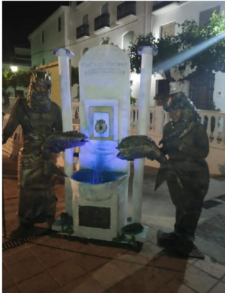
3º PREMIO DE DISFRAZ TITULADO FUENTE DI FORTUNA