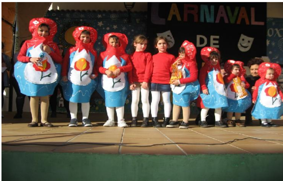
3º Premio de disfraces por grupos

Y ya solamente nos queda el gran Concurso de Disfraces para mayores que como todos sabéis es por la noche mágica del Lunes al Martes de Carnaval, es difícil esta noche ya que son muchísimas las personas y grupos que llegan a la Plaza a partir de las once de la noche, existe un video que está puesto en la página WER del Ayuntamiento, ahí se puede comprobar la magnitud de estas fiesta de Tolox, ¿Cuántas personas pueden asistir a este espectáculo?, no lo sé pero sin exagerar yo diría que más de 1.500 personas se reúnen en esta Plaza Alta, y cosa curiosa todo el mundo va disfrazado, y digo que en Tolox nuestros paisanos tienen una gracia especial para esto, hay disfraces de todos los colores, algunos magníficos y todo esto en esta noche mágica y sin dejar de bailar, la orquesta "Los Carcianos y "DJ profesional "Hasta que el cuerpo aguante" estuvo toda la noche animando con su música hasta cerca de las ocho de la mañana siguiente.