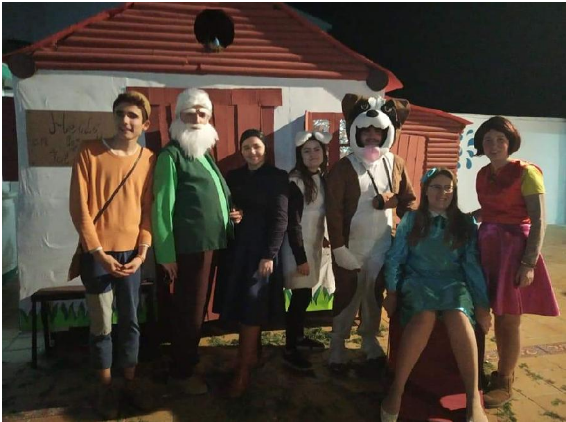
5º PREMIO DEL CONCURSO DE DISFRACES DEL CARNAVAL DE TOLOX 2019 "LA CASITA DE HEIDI"