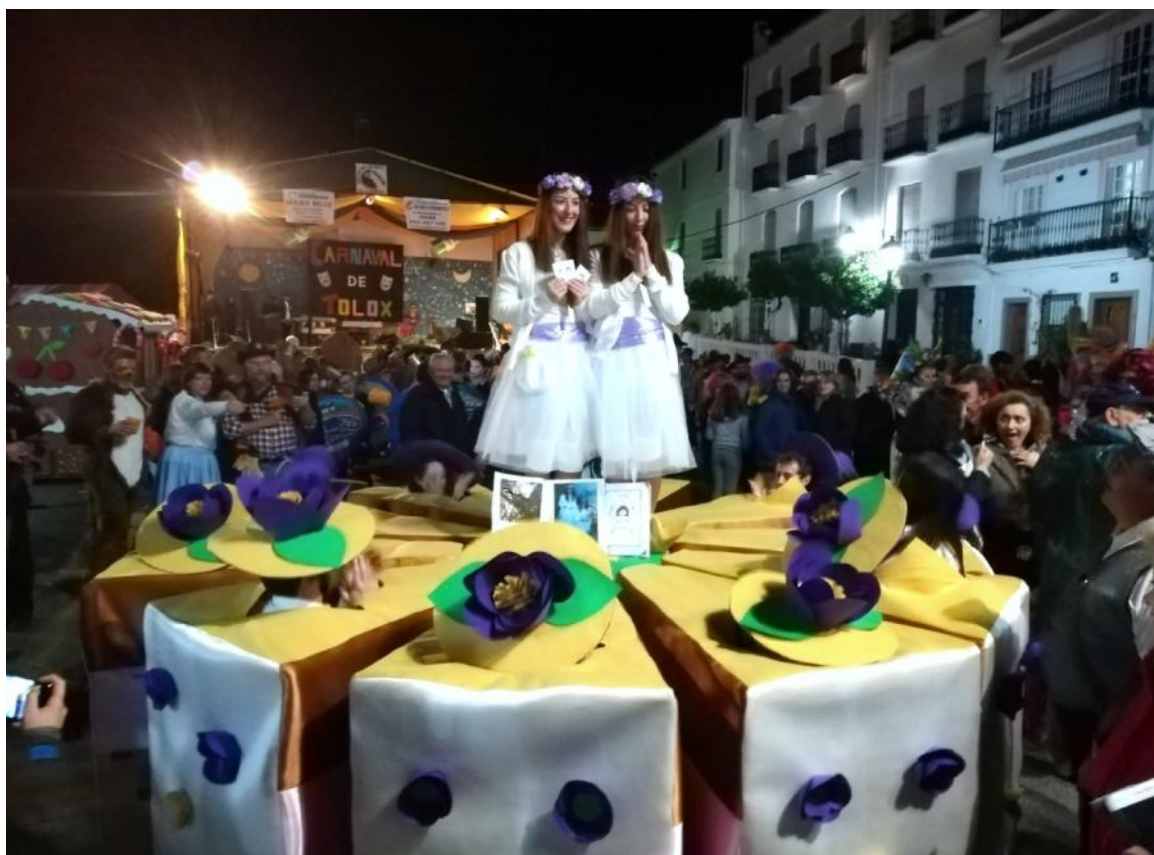
LA TARTA 2º PREMIO DE DISFRACES DEL CARNAVAL DE TOLOX 2019