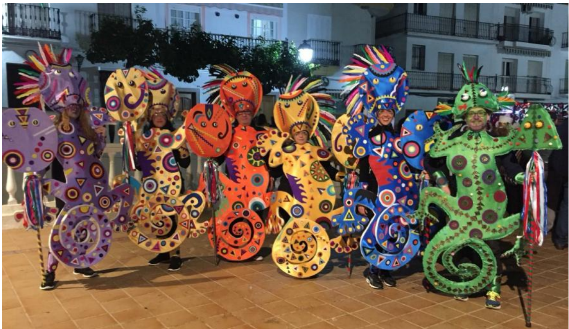
4º PREMIO DE DISFRACES DEL CARNAVAL DE TOLOX 2019 LOS CAMALEONES