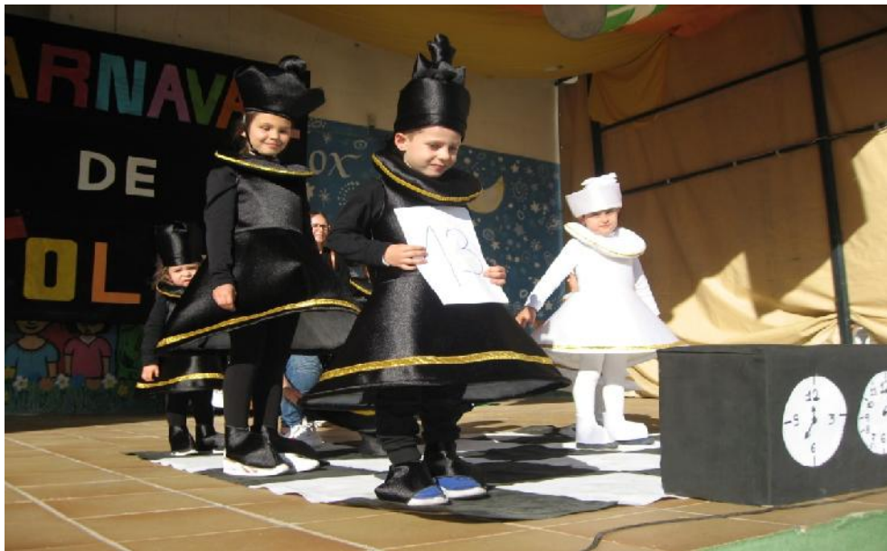
Segundo premio del Concurso de disfraces por grupos