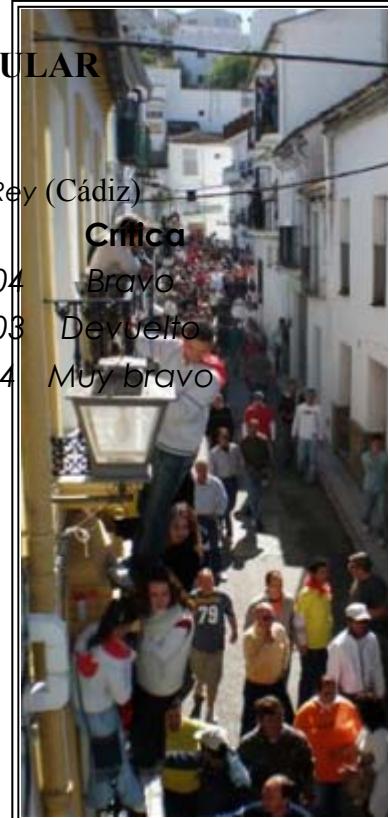
LA GENTE ABARROTA LAS recogidos

Colabora: Peña Taurina Toro de Cuerda. Diputación Prov. Málaga.