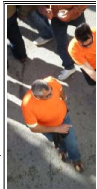
Los organizadores su

Como muy bien recoge la publicación rondeña, la jornada transcurrió sin incidentes dignos de mención y donde las miles de personas que llenaron nuestras calles, plazas y bares disfrutaron de una fiesta taurina distinta y apasionante, con normalidad para regocijo de la nueva Peña Taurina del Toro de Cuerda que fueron los encargados de velar por el cumplimiento de la normativa, de la protección que los animales necesitan y de evitar incidentes a lo largo del recorrido. El esfuerzo para que el festejo haya sido considerado de "exitoso", se debe en gran parte