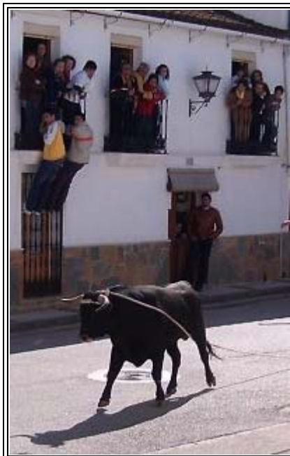
El 2º fue devuelto

Como muy bien recoge la publicación rondeña, la jornada transcurrió sin incidentes dignos de mención y donde las miles de personas que llenaron nuestras calles, plazas y bares disfrutaron de una fiesta taurina distinta y apasionante, con normalidad para regocijo de la nueva Peña Taurina del Toro de Cuerda que fueron los encargados de velar por el cumplimiento de la normativa, de la protección que los animales necesitan y de evitar incidentes a lo largo del recorrido. El esfuerzo para que el festejo haya sido considerado de "exitoso", se debe en gran parte