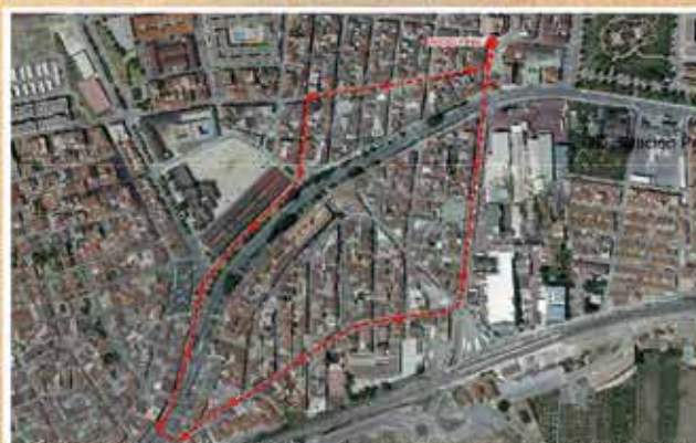
RECORRIDO PROCESIÓN SAN ISIDRO LABRADOR 2020

Tras finalizar la Procesión, contaremos con un espectáculo de fuegos artificiales, anunciando la finalización del recorrido procesional.