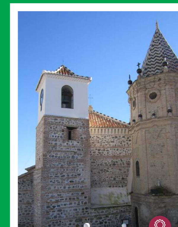
IGLESIA NTRA. SRA. DEL ROSARIO