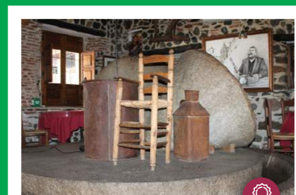
MUSEO DEL BANDOLERO