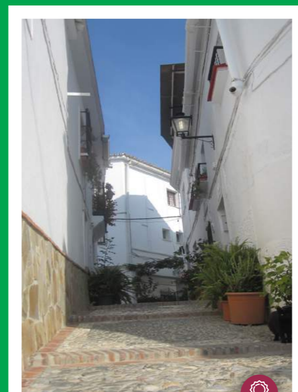
CALLE ANTONIO MACHADO

Plaza de la Constitución nº1 29718 El Borge tfn. 952512033 fax. 952512222 www.elborge.es blogs. http://elborgeblog.blogspot.com.es/ ayuntamiento@elborge.es