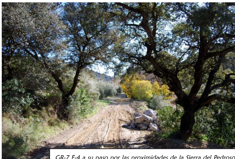
GR-7 E-4 a su paso por las proximidades de la Sierra del Pedroso

Las rutas senderistas homologadas próximas a estos espacios naturales pertenecen al sendero de gran recorrido GR-7 E-4. Concretamente se trata del tramo que une la localidad de Villanueva de Algaidas con Villanueva de Tapia, el cual pasa al norte de la sierra del Pedroso, adentrándose en parte del encinar que llega hasta la cumbre.