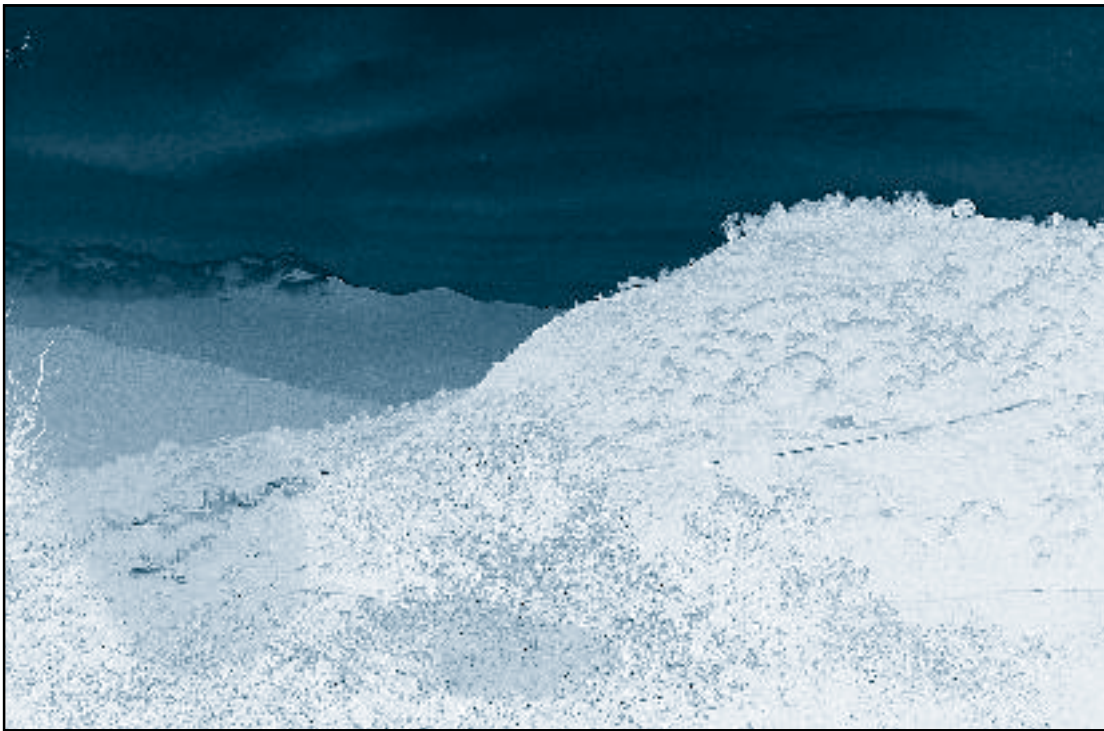
Benalauría a los pies del Cerro (al fondo, el viento de Levante acumula nubosidad sobre las cumbres de Sierra Bermeja).

Es su hechura a manera de una nave cuya proa mira al norte y popa al mediodía, su costado izquierdo está pegado al monte y cae al poniente y el derecho mira al levante con una vista muy dilatada, por lo que la baña el sol luego que nase.