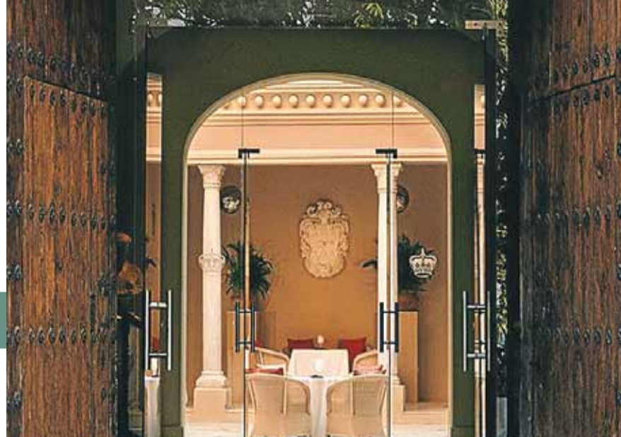
At være omgivet af ro, lys, luksus og enkelthed giver ganske banal glæde.

net, hvis du forstår? Kurbade er fra begyndelsen tænkt som forebyggelse. Den bedste brug af et ophold er ved at tage af sted hvert år for at lære sin krop at kende, pleje den, holde den sund, før det går galt, siger han og understreger, at det også er en del af behandlingen at være ude af vandet.