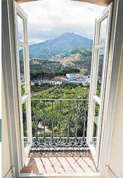
Hotellet i Carratraca har fem stjerner og er i eksklusiv stil, selvfølgelig med solskin og udsigt over dalen.