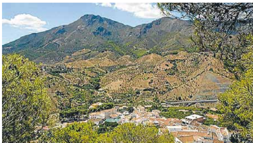
Midt i de sydspanske bjerge kan man få sol og blødt vand til både sind og krop. Carratraca ligger cirka tre kvarters kørsel fra Malaga, der ligger tre timers flyvetur fra Aalborg.