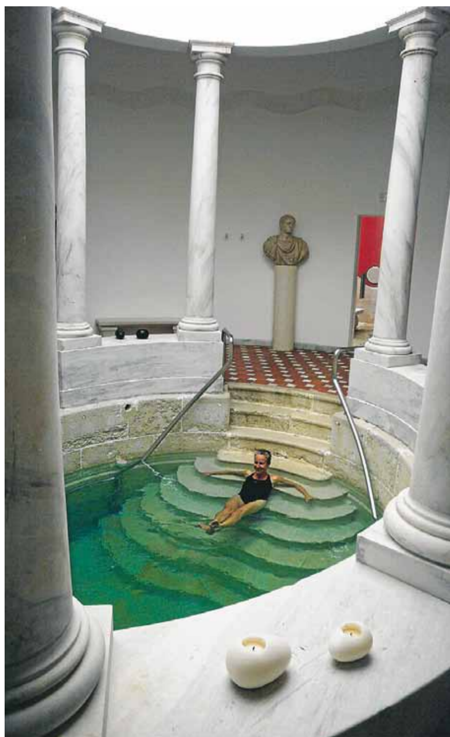
Vel er jeg ikke Kleopatra, men dog siger jeg, at man føler sig som en kejserinde i de romerske bade i Carratraca i Andalusien, der satser millioner på at gøre spaniere og turister sundere og smukkere.