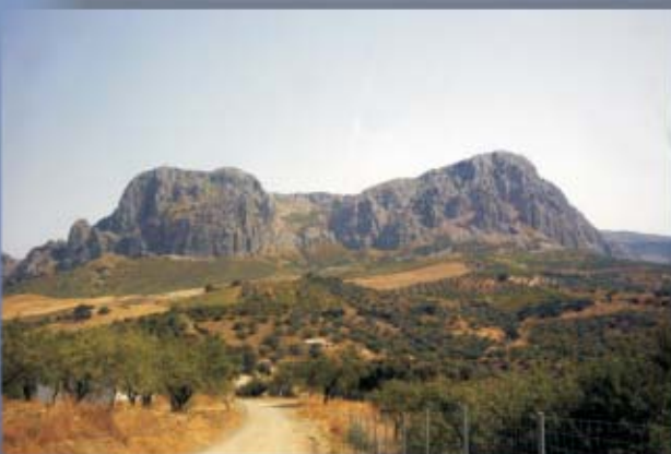
Tajos Gomer y Doña Ana, Ruta de los Tajos