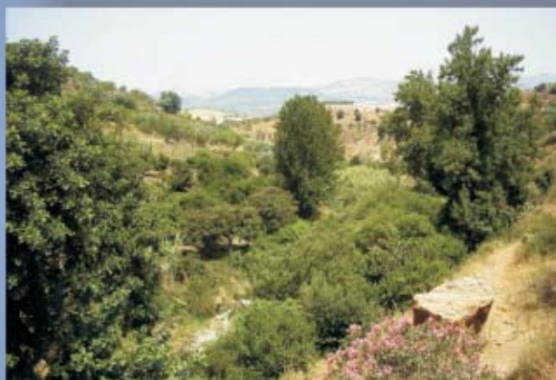
Alamos Blancos, Ruta del Río