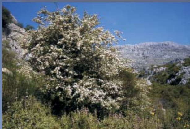
Espino Majoleto, Ruta de la Sierra

No olvidaremos en este itinerario el gran valor ecológico que posee la ruta. Observaremos sierras, con bosque mediterráneo, resaltando de su fauna rica y variada la cabra montés, alguna que otra águila perdicera, zorro, jineta, perdiz roja, conejo, liebre, ... Las especies arbóreas que crecen, suelen ser de hoja perenne, pequeña y coriácea para soportar mejor las sequías estivales: encina, alcornoque y espinos majoletos, acompañados de acebuches, quejigos, algarrobos, etc. son los principales árboles que podemos encontrar. En el suelo proliferan las plantas aromáticas como romeros, salvias, lavanda o cantueso, lentisco, jara, etc.