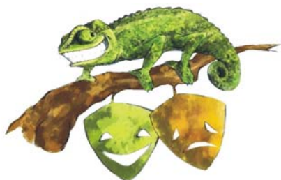
TEATRO EL LUGÁ