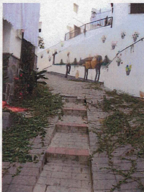
Vista de calle Río Verde