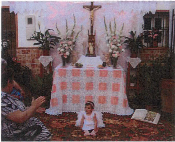
Altar puesto en el rincón de Encarna la Serena