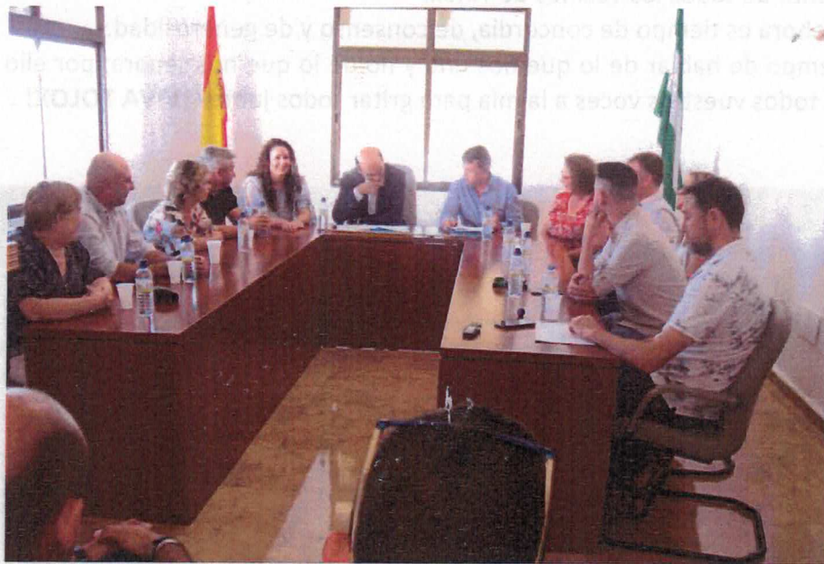
Constitución de la Mesa del nuevo Ayuntamiento con todos sus Concejales y Alcalde

Quienes nos dedicamos a la política sabemos que ser Alcalde o Concejales es muy gratificante, porque aquí, como en ningún otro puesto, se puede comprobar la eficacia y la inmediatez de nuestras decisiones; pero también supone uno de los cometidos más exigentes, al estar bajo la rigurosa y permanente vigilancia de los ciudadanos sobre las medidas que se toman para la solución de sus problemas y también poder erigirnos en altavoz de sus necesidades. Así pues, estimados Concejales y Concejales, bienvenidos a esta casa que es la casa de todos, desde la que espero y confío en que sepamos poner a disposición lo mejor de nosotros mismos. Asumo pues, con el debido agradecimiento, el respaldo ciudadano que ha recibido el Partido Popular, que ha sido lo mismo que el PSOE pero, evidentemente soy consciente de que la lista que encabezo no goza del apoyo de una mayoría, lo que requiere un claro ejercicio de humildad, de autocrítica y de análisis que, les aseguro, hemos hecho y seguiremos realizando. Capacidad de compromiso, diálogo y decisiones compartidas son, por tanto, los pilares de esta legislatura que hoy inauguramos.