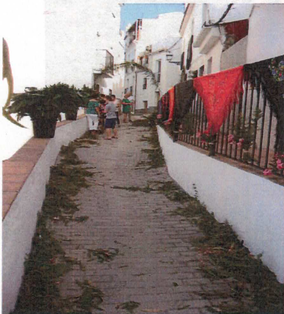
Vista de la Calle Balcón de San Cristóbal.