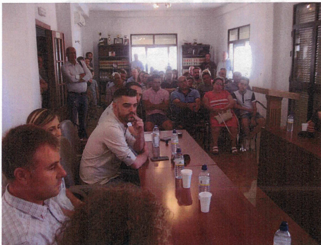
Aspecto que presentaba el Salón de Plenos durante el acto de nombramiento del nuevo gobierno de Tolox

Hoy es tiempo de hablar de lo que nos une y no de lo que nos separa, por ello quiero que unáis todos vuestras voces a la mía para gritar todos juntos ¡VIVA TOLOX!