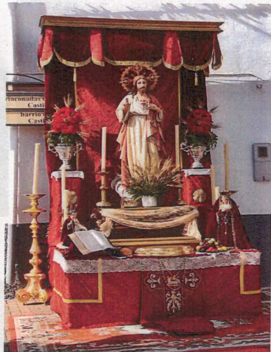
Altar puesto por la Hermandad del Santísimo