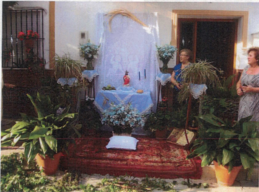
Altar en la calle Ancha puesto por Luci Angelita y vecinas