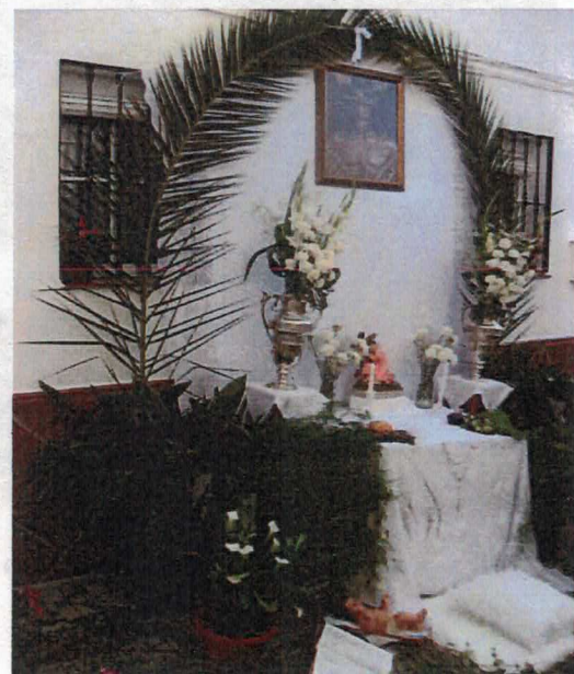
Altar en Balcón por Isabel Pistolo y vecinas