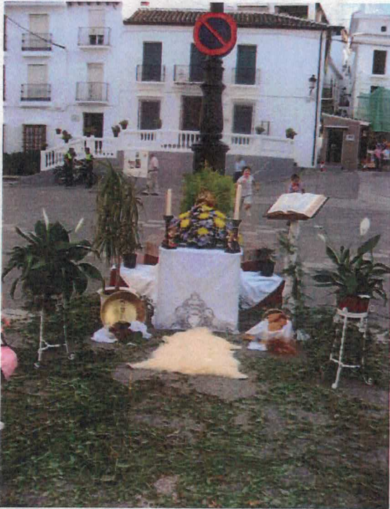
Altar en la Plaza Alta puesto por As. Pecho Venus