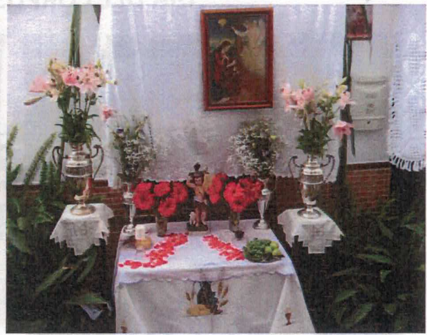
Altar puesto por Belí y las vecinas de dicha calle