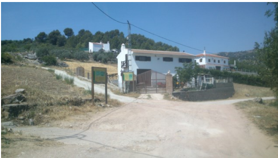
WPT3. Inicio de coincidencia con GR 243 Etapa 2 y los senderos La Fuensanta y Puerto de la Mujer