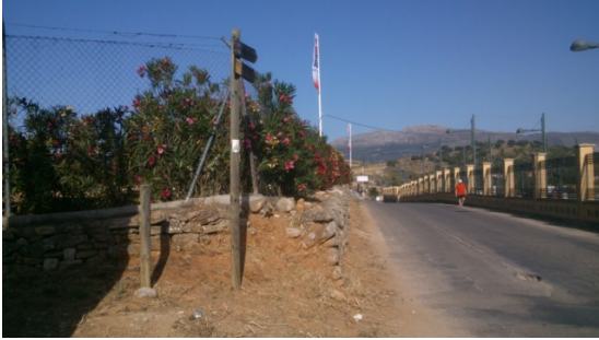
WPT1. Inicio de etapa y de coincidencia con GR 249 Etapa 23 y PR-A 71