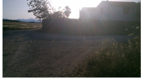
WPT2. Fin de coincidencia con PR-A 71