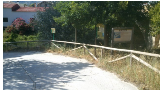
WPT4. Fin de etapa y de coincidencia con GR 249 Etapa 23, GR 243 Etapa 2, La Fuensanta y Puerto de la Mujer