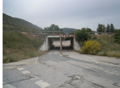
WPT8. Asfalto, paso bajo autovía A-45