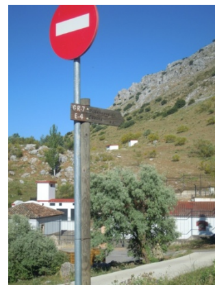
WPT4. Enlace con SL-A 22