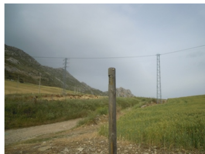
WPT6. Fin de coincidencia 2 con carretera A-7075