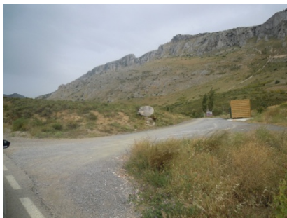
WPT3. Fin de coincidencia con carretera A-7075