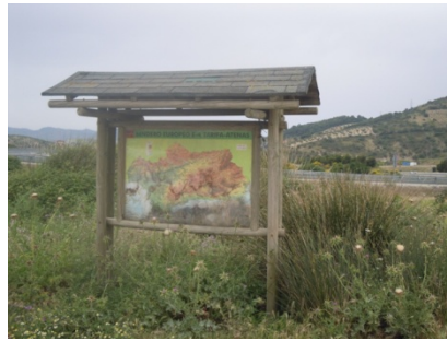
WPT9. Fin de etapa y enlace con GR 7 E-4 Etapa 1N y Etapa 1S