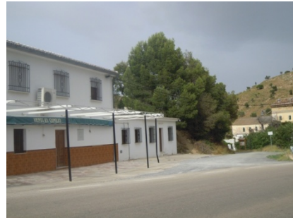
WPT2. Inicio de coincidencia con carretera A-7075