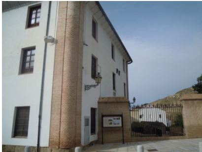
WPT1. Inicio de sendero