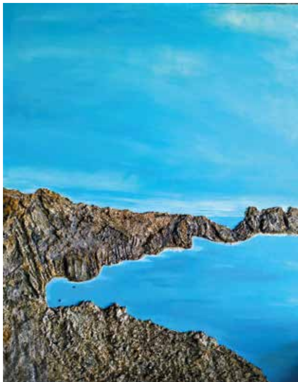
PILAR ESPEJO GUTIÉRREZ ABIERTO Técnica mixta | 80 x 100 cm