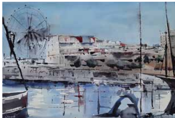
CONCEPCIÓN FERNÁNDEZ LLAQUET IMMOBILE Acuarela | 56 x 38 cm