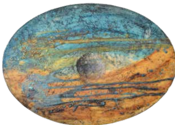
ÁNGELES MARTÍNEZ SERRANO LEJANÍA Encáustica | 59 x 41 cm