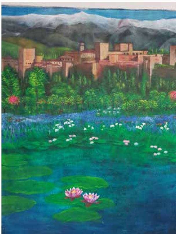
ISABEL VIEIRO TORRES CONFINAMIENTO EN GRANADA Óleo/lienzo | 200 x 200 cm