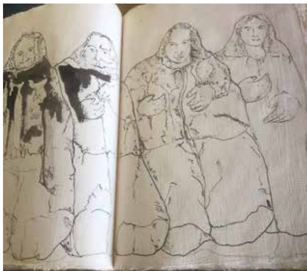
JUAN PINILLA LIBRO DE AUTOR Dibujo/papel | 30 x 40 cm