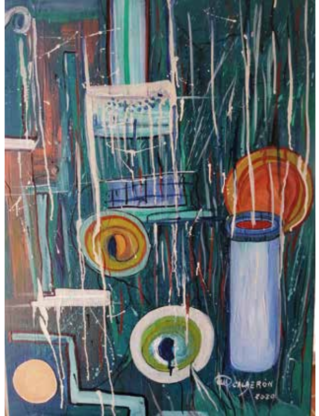
CARMEN CALDERÓN CONFUSIÓN EN LA PANDEMIA Técnica mixta | 79 x 60 cm