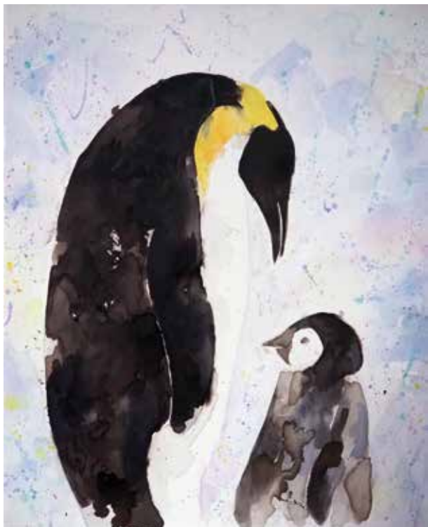
JULIE RODRÍGUEZ LOVE Técnica mixta | 54 x 65 cm