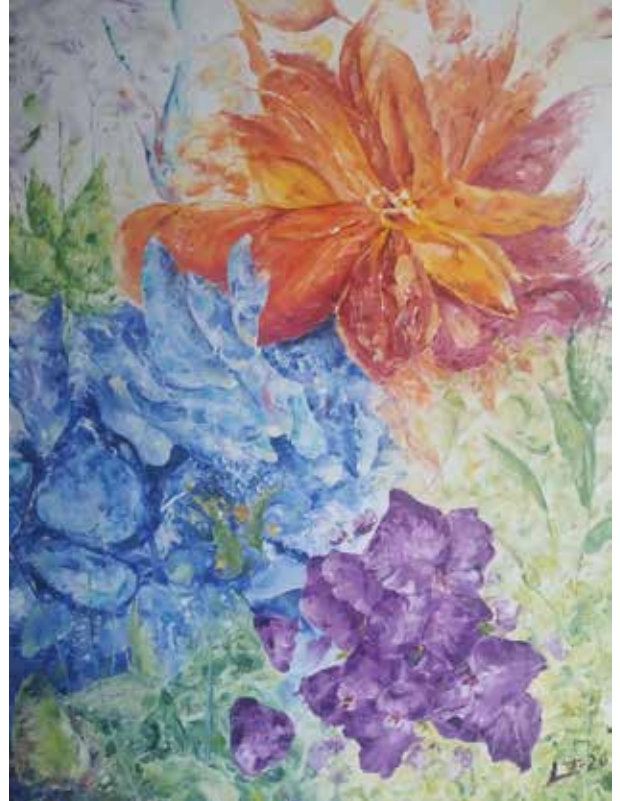
JUAN ANTONIO RAMÍREZ CUETO PRIMAVERA EN CONFINAMIENTO Óleo/lienzo | 70 x 50 cm