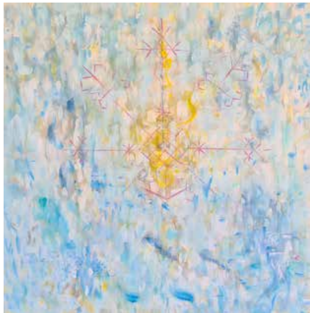
RIMA PAUKSTE ÁRBOL DE LA VIDA Acrílico/lienzo | 90 x 90 cm