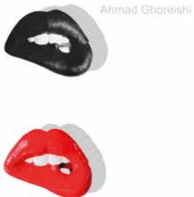
AHMAD GHOREISHI AYEROJO, AYENEGRO Cerámica-pintura | 27 x 19 x 8 cm