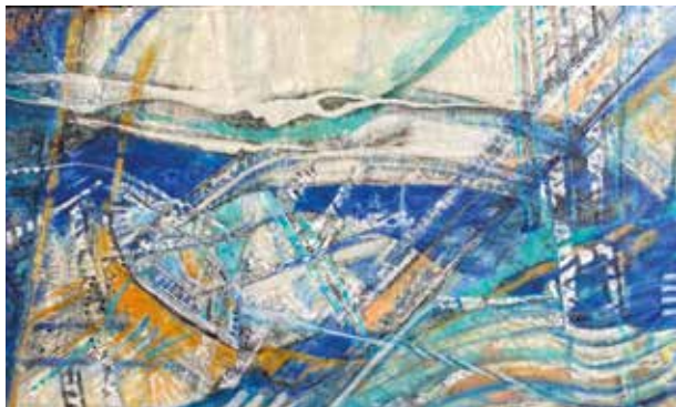
SILVANA ORCESE TALLER 23 Encáustica | 100 x 60 cm