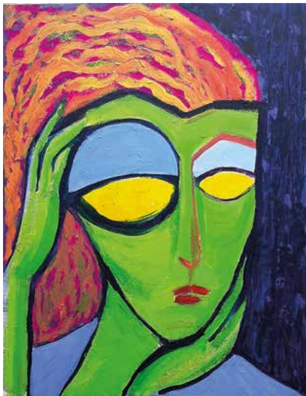
AGA STRAUSS NUEVA NORMALIDAD 2020 Acrílico/tabla | 42 x 54 cm