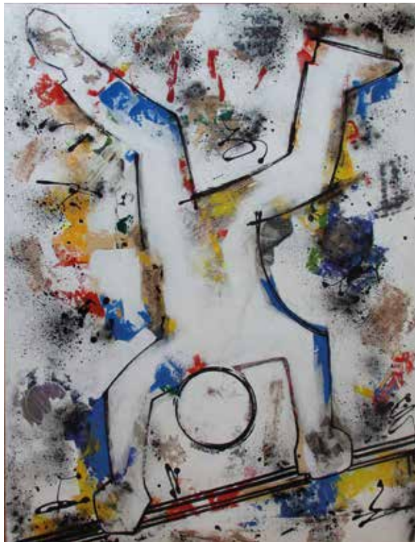
EZEQUIEL PÁEZ DESCONCIERTO Acrílico/lienzo | 68 x 88 cm