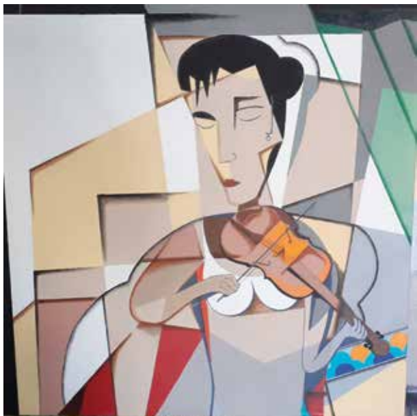
A. SANTAREM VIOLINISTA III Técnica mixta/lienzo | 60 x 60 cm