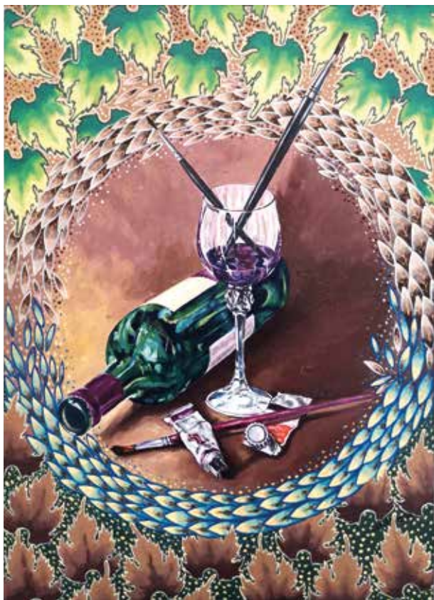
CARLOS A. DÍAZ CURANDO EL ALMA Óleo/lienzo | 50 x 61 cm