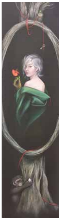
KORA ALEGORÍA Técnica mixta/tela | 60 x 220 cm