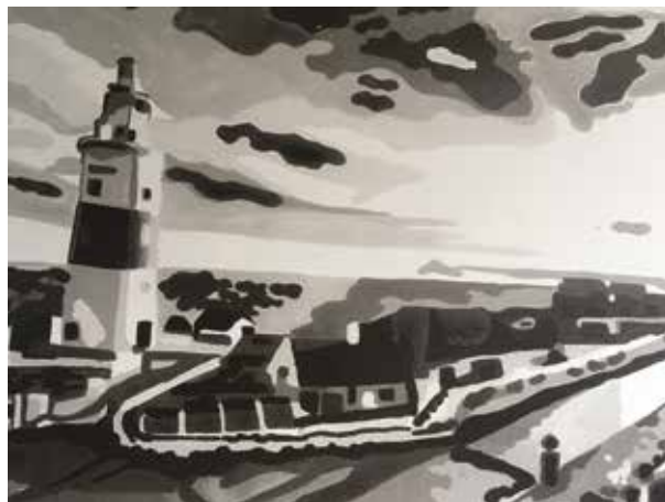
JUAN JOSÉ ARCHILLA EUROPA POINT Digital/papel | 21 x 29,7 cm