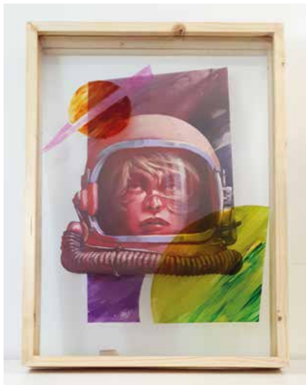
KAFREMAN (CARLOS ARANDA) ALBA Técnica mixta | 40 x 58,5 cm