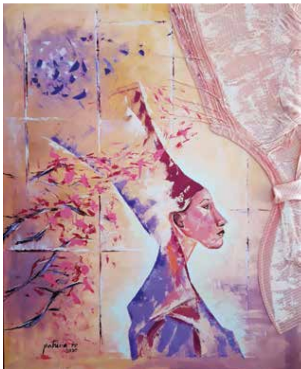
PATRICIA RO BÚSQUEDA DE LA ARMONÍA Técnica mixta/lienzo | 100 x 81 cm