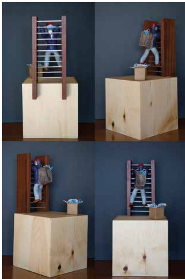
FRANCISCO MENJÍVAR PASTOR YA ESTÁN AQUÍ LAS MASCARILLAS ¿Y AHORA QUÉ? Técnica mixta | 25 x 44 x 20 cm