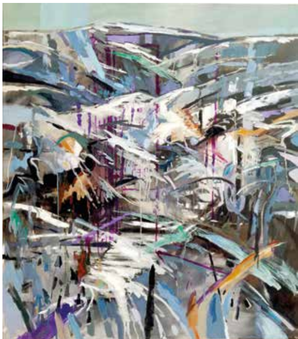
JAVIER PEINADO HUERTAS VARIACIONES SOBRE UN BOSQUE NEVADO V Técnica mixta/tabla | 90 x 100 cm