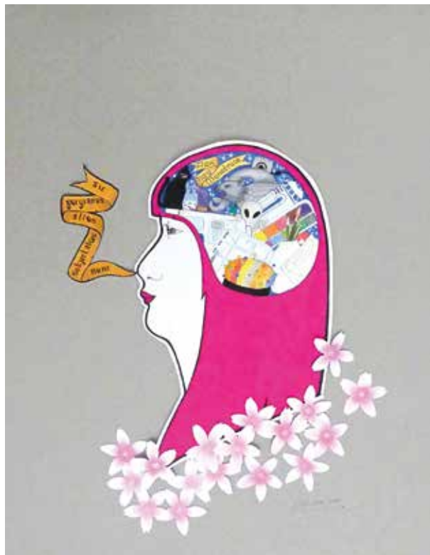
LORETO IZQUIERDO AUTORRETRATO CON PAISAJE INTERIOR Técnica mixta | 40 x 50 cm