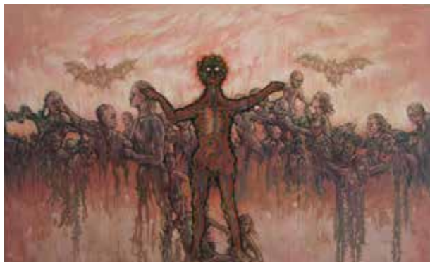
RAFAEL JAIME EL CONTAGIADOR Óleo/tela | 130 x 81 cm