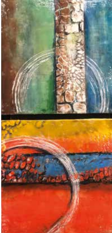
LUDMILA SERRA VENEZUELA Encáustica | 30 x 60 cm