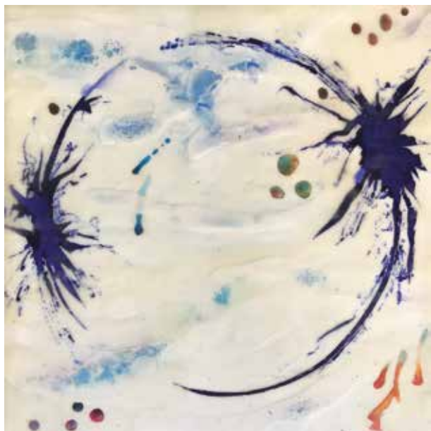
GABRIEL LÓPEZ BISECCIÓN COVID 19 Encáustica/cartón | 30 x 30 cm