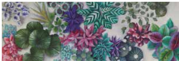
AURORA VÁZQUEZ ABRIL Acrílico/lienzo | 150 x 50 cm