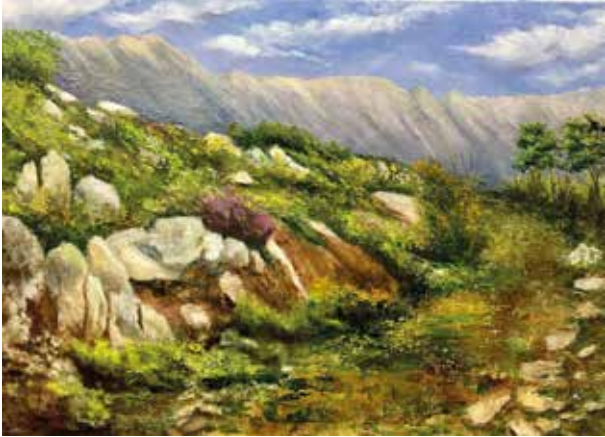
PILAR ANARTE NATURALEZA Óleo/lienzo | 70 x 50 cm