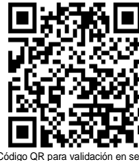
Código QR para validación en sede

Regulación CSV: Decreto 3628/2017 de 20-12-2017