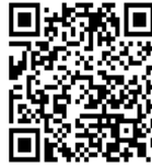
Código QR para validación en sede

Regulación CSV: Decreto 3628/2017 de 20-12-2017