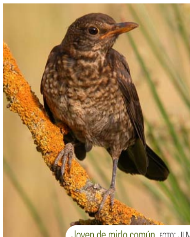
Joven de mirlo común.

Agua arribas de Cuevas Bajas, a las orillas del río, hay un observatorio