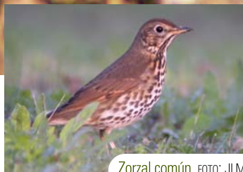
Zorzal común.

época del año que están entre nosotros y vinculados a los cortados arenosos del borde del río, ruiseñor común, tarabilla común, alcaudón común, grajilla y, de nuevo, las especies propias de los núcleos urbanos (tórtola turca, vencejos, avión común y gorrión común).