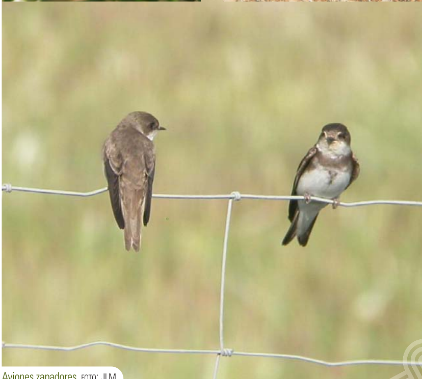
Aviones zapadores.