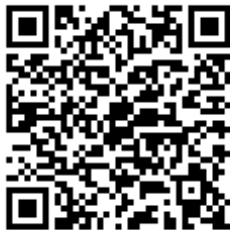
Código QR para validación en sede

Regulación CSV: Decreto 3628/2017 de 20-12-2017