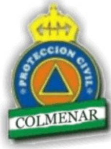
Ayuntamiento de Colmenar