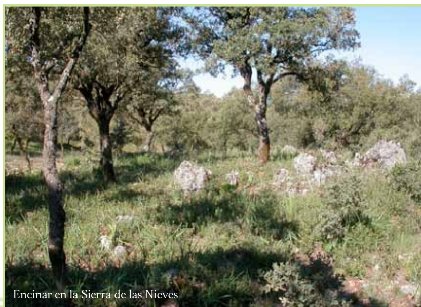
Encinar en la Sierra de las Nieves