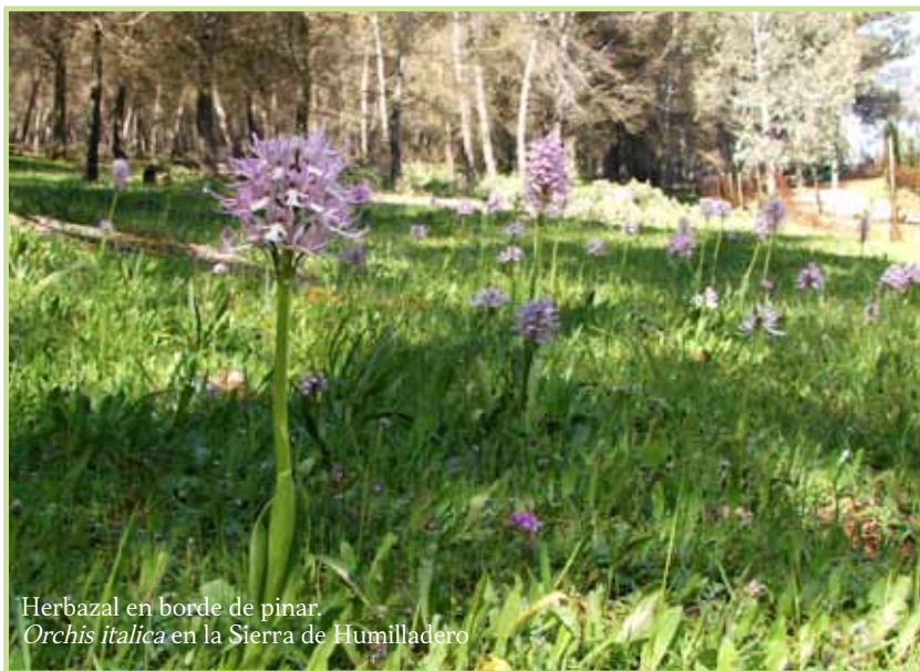
Herbazal en borde de pinar. Orchis italica en la Sierra de Humilladero