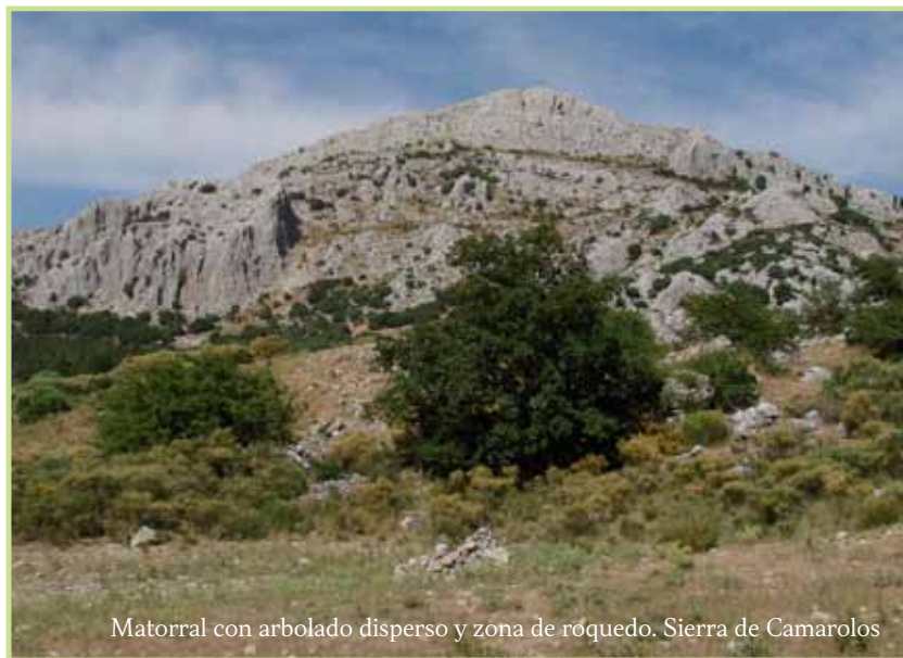
Matorral con arbolado disperso y zona de roquedo. Sierra de Camarolos

Otras especies necesitan más luz solar y aprovechan los bordes de los caminos de las zonas forestales y los bordes de los bosques. En los alcornoques pueden observarse por ejemplo Epipactis tremolsii , Limodorum abortivum y Orchis langei . Los pinares costeros son el hábitat de Gennaria diphylla , especie litoral amenazada. Los encinares también acogen a multitud de especies, como Limodorum trabutianum y Spiranthes spiralis . En los castañares destacan Dactylorhiza insularis y Orchis langei .