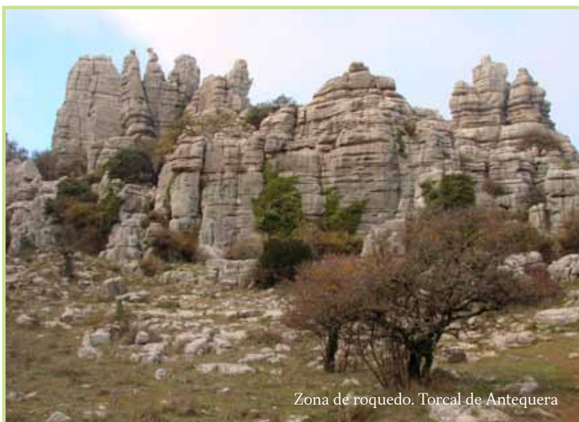
Zona de roquedo. Torcal de Antequera