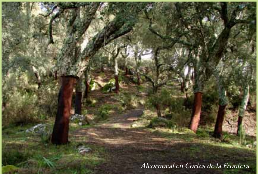
Alcornocal en Cortes de la Frontera

La presencia de las diferentes especies de orquídeas va estar condicionada por diferentes factores. La transformación de los ecosistemas naturales por la acción humana es, sin duda, uno de los que más condiciona la presencia de orquídeas en el territorio. Pero también los requerimientos de estas interesantes plantas para poder sobrevivir son