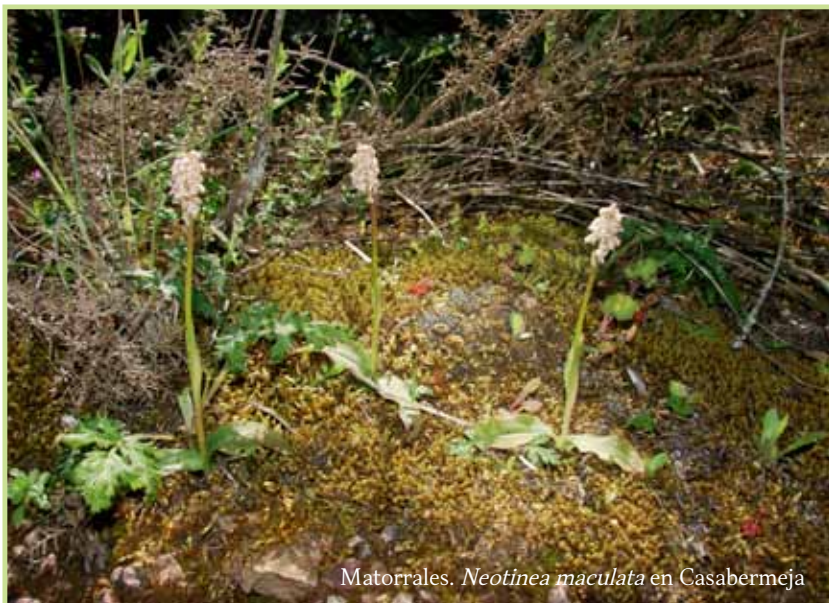
Matorrales. Neotinea maculata en Casabermeja