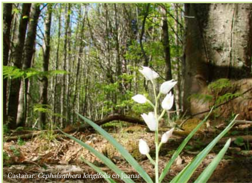
Castañar. Cephalanthera longifolia en Juanar