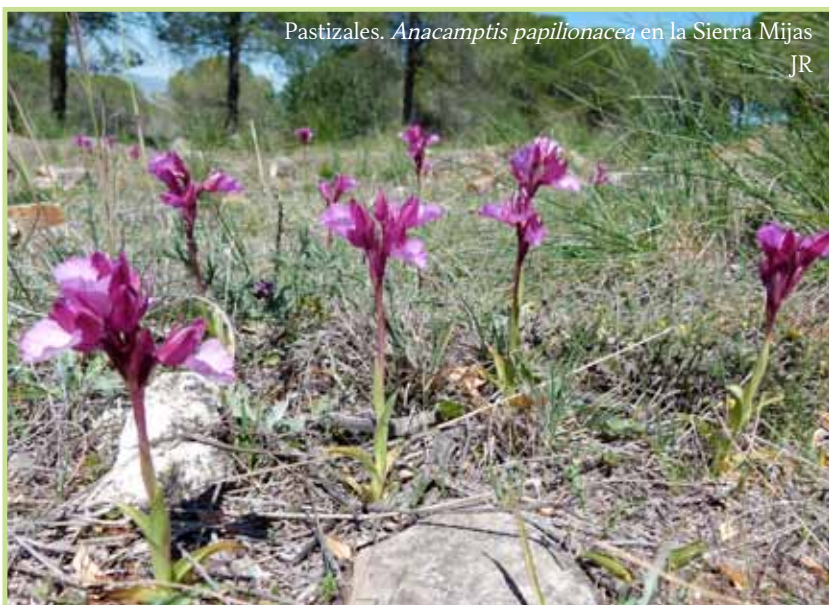
Pastizales. Anacamptis papilionacea en la Sierra Mijas JR