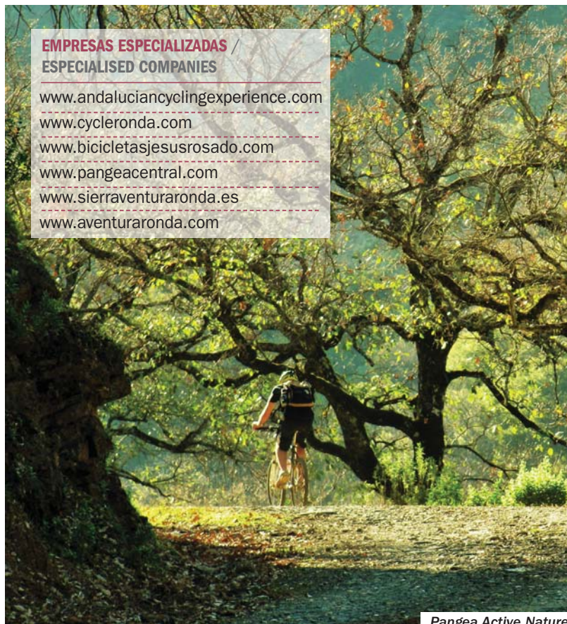
Pangea Active Nature