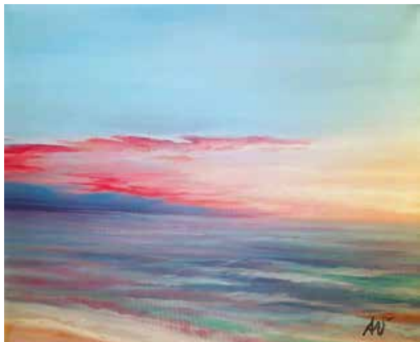
AURORA VÁZQUEZ SUR Acrílico / lienzo | 38 x 46 cm