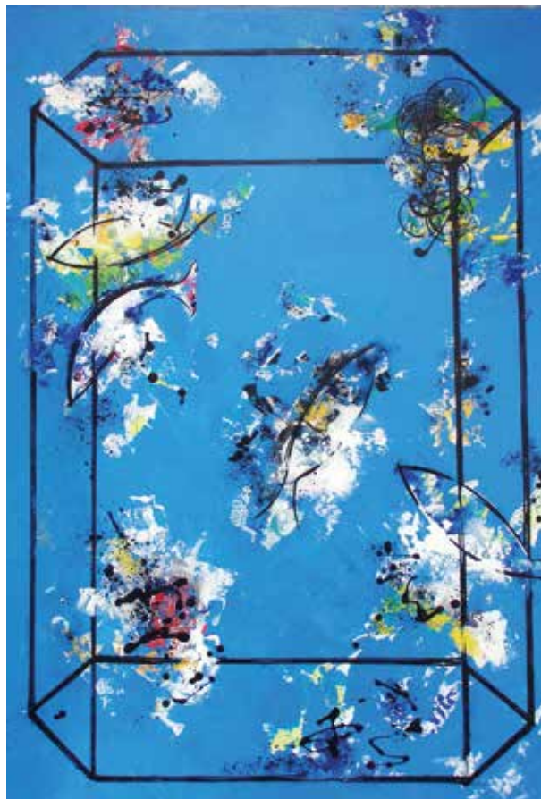
EZEQUIEL PÁEZ NÚMERO 33 Acrílico / lienzo | 70 x 100 cm