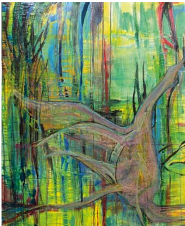
SILVANA ORCESE MIGRANDO Encáustica | 100 x 80 cm