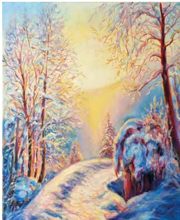
ANFISA ZINCHENKO ATARDECER DE INVIERNO Óleo / lienzo | 40 x 50 cm