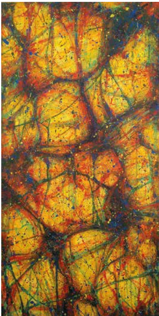
OROZKO CAVIDADES INTERIORES II Técnica mixta / papel | 50 x 99 cm