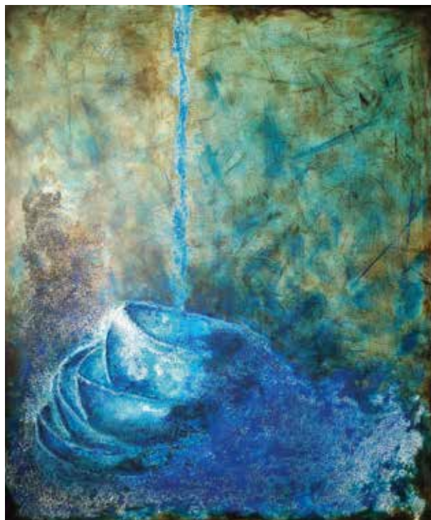
PILAR ESPEJO GUTIÉRREZ GOTA A GOTA Técnica mixta / lienzo | 100 x 120 cm