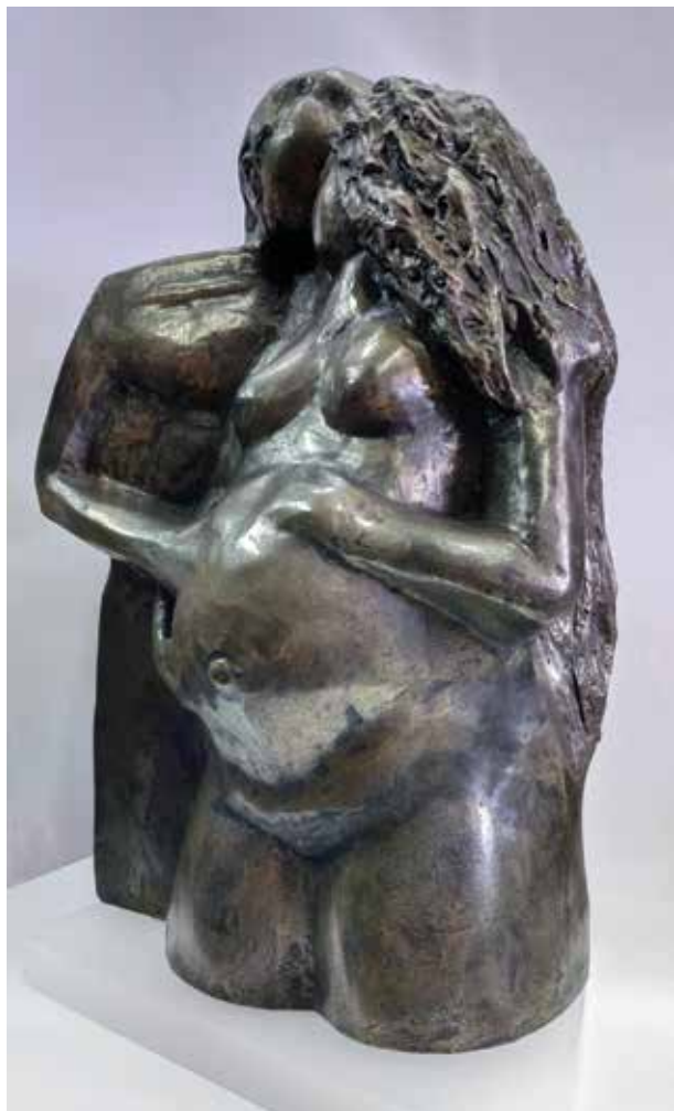
JOSÉ PEREIRO LOZANO TENER MELLIZOS EN 2020 Bronce micronizado | 30 x 20 x 20 cm