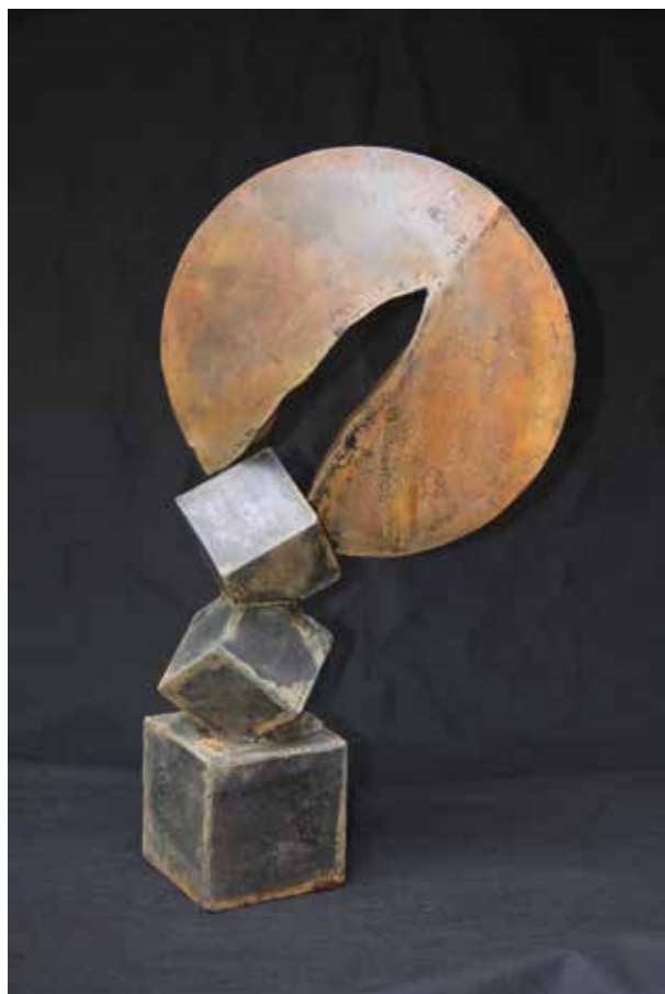
THOMAS FISCHER ESFERA CON CUBOS Acero corten patinado y barnizado | 70 x 33 x 20 cm