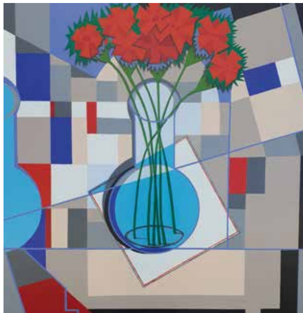
ADOLFO SOTO SANTAREM INTERIOR CON FLORERO Técnica mixta / lienzo | 100 x 100 cm