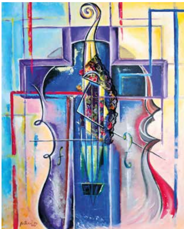
PATRICIA RO SENTIDOS Técnica mixta | 65 x 81 cm