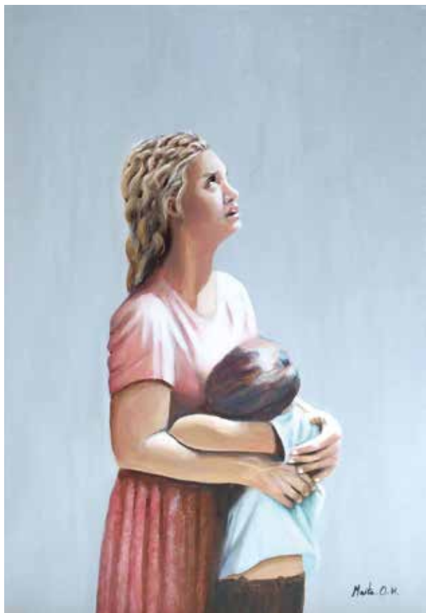
MAITE ORTEGA HIJANO TODO VA A IR BIEN, MI AMOR Acrílico / lienzo | 50 x 70 cm