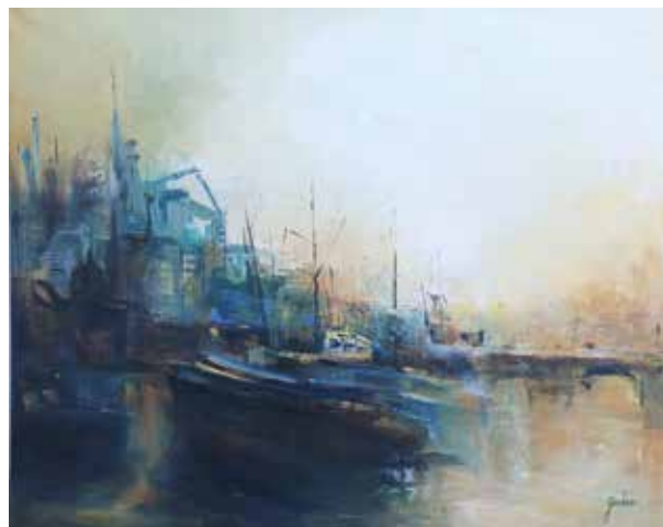
GRISELDA GIACHERO ESPACIOS PORTUARIOS Óleo / lienzo | 100 x 80 cm