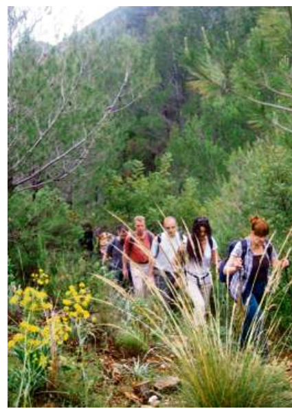
Über schmale Pfade geht es bergauf