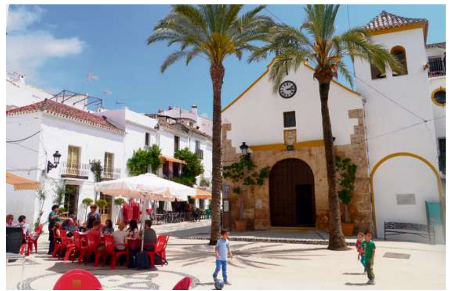
Nach der Wanderung entspannen in Ojén