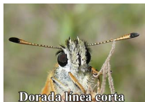
Dorada línea corta

Dorada línea corta: solo confundible cerrada, tiene las puntas de las antenas negras. Dorada línea larga: solo confundible cerrada, tiene el ala trasera de un tono pajizo. Dorada manchas blancas: más grande y robusta; solo confundible abierta, pero con menor cantidad de puntos sin formar arco. Dorada orla ancha: más grande y robusta; solo se puede confundir de alas abiertas, pero tiene menor cantidad de puntos y no forman arco, además de la línea negra (androconia) más grande y menos marrón tanto hembras como machos.