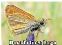
Dorada línea larga