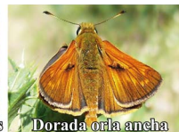
Dorada orla ancha