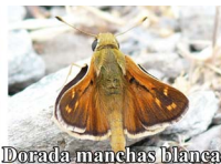
Dorada manchas blancas