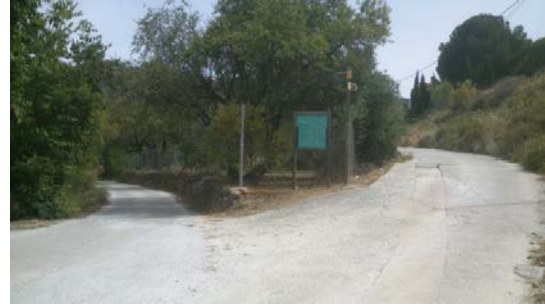
WPT2. Fin de coincidencia con PR-A 276 y PR-A 277