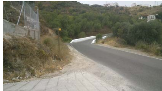
WPT4. Fin sendero