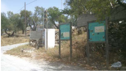
WPT1. Inicio de sendero y de coincidencia con PR-A 276 y PR-A 277