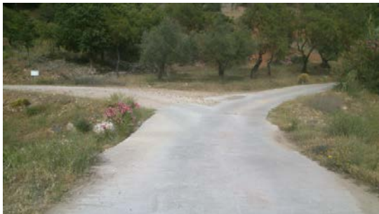
WPT3. Cruce de arroyo