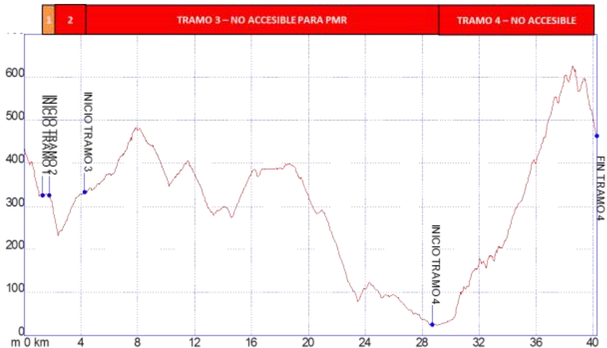
Gráfica I: Identificación tramos etapa32, nivel de accesibilidad.