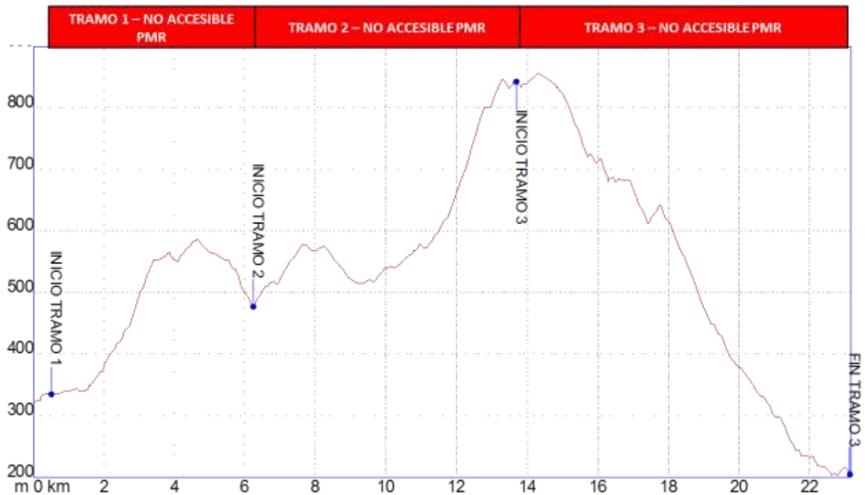
Gráfica 1: Identificación tramos etapa20, nivel de accesibilidad.

➤ PERFIL ETAPA20: Perfil de altitud e identificación por tramos.