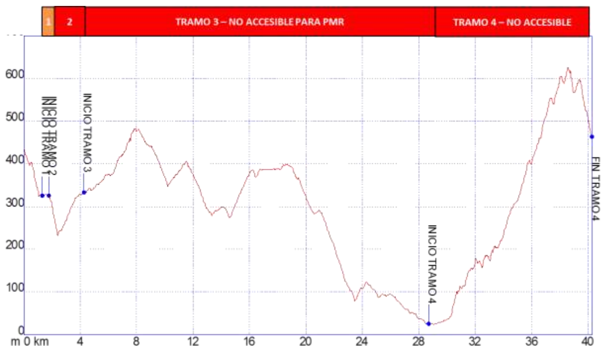
Gráfica 1: Identificación tramos etapa32, nivel de accesibilidad.

Los tramos que se han identificado en la etapa 32 Ojén – Mijas para personas con movilidad reducida son los siguientes: