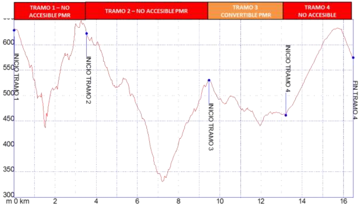
Gráfica 1: Identificación tramos etapa8, nivel de accesibilidad.

➤ PERFIL ETAPA8: Perfil de altitud e identificación por tramos.