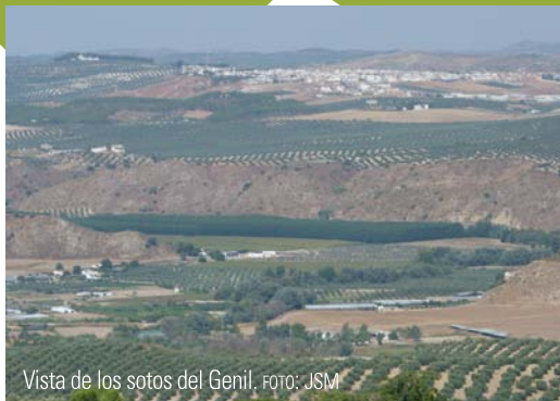
Vista de los sotos del Genil.

Comienza la etapa en el norte de Villanueva de Algaidas, siendo esta la dirección predominante de todo el recorrido. Son 10,1 km por terrenos de olivar hasta que se alcanza la localidad de Cuevas Bajas.