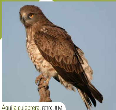
Águila culebrera.

Desde el mismo inicio de la etapa, en la cueva de Nerja, tendremos ocasión de observar comunidades de aves propiamente forestales, que se enriquecen conforme ascendemos y nos adentramos en la zona de pinar. Las vistas a los impresionantes tajos y picos de la sierra Almijara nos acercarán a especies de montaña y nos permitirá observar algunas grandes rapaces. Las zonas de roca desnuda acogen a las especies propias de estos medios,