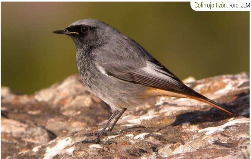
Colirrojo tizón.

Los acantilados de Maro y Cerro Gordo, aunque no quedan recogidos en la etapa, merecen una visita. Además de poder observar las especies marinas y costeras mencionadas en las etapas 3 y 4, es un buen lugar desde el que observar a la pardela cenicienta, ya que durante los meses de verano suelen formar balsas de hasta un centenar de ejemplares al atardecer, que pueden observarse desde la costa. ◉