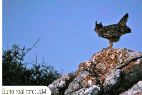
Búho real

Otros mamíferos presentes en la zona son la cabra montés, cuya observación es relativamente fácil, así como otras especies vinculadas a ambientes rocosos, como la garduña, bastante más difícil de observar. A lo largo de la etapa tendremos la ocasión de observar numerosas marcas de zorro sobre piedras y plantas, al mismo borde del camino. Con respecto a la vegetación, merece la pena destacar la aparición de especies de gran interés, como el africanismo Maytenus senegalensis , y las especies Buxus baleárica y Cneorum tricocum .