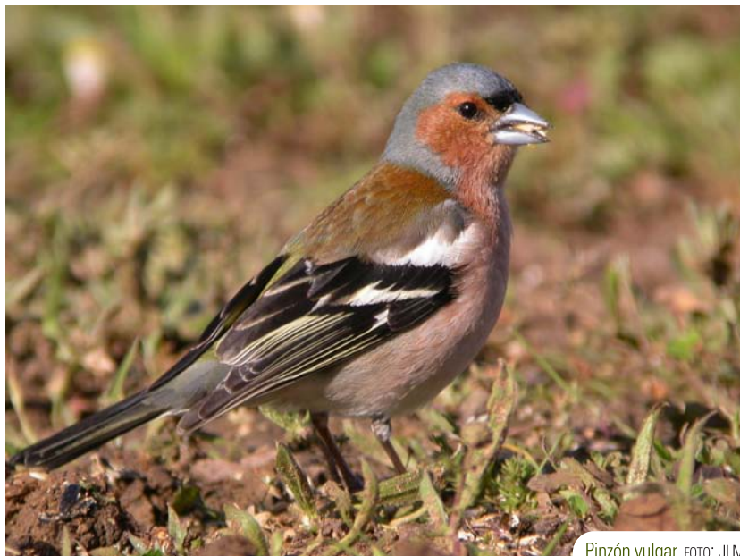
Pinzón vulgar.

el águila perdicera y el búho real. En el punto de inicio son especies típicamente asociadas a medios urbanos las presentes (básicamente tórtola turca, gorrión común, estornino negro y colirrojo tizón en invierno), si bien la zona ajardinada de la cueva de Nerja acoge una elevada diversidad de especies forestales propias de los bosques que se cruzarán a lo largo de la etapa. De este modo, desde el mismo lugar de inicio podrán observarse reyezuelo listado, agateador común, papamoscas gris, carboneros común y garrapinos, herrerillo capuchino y pinzón vulgar.