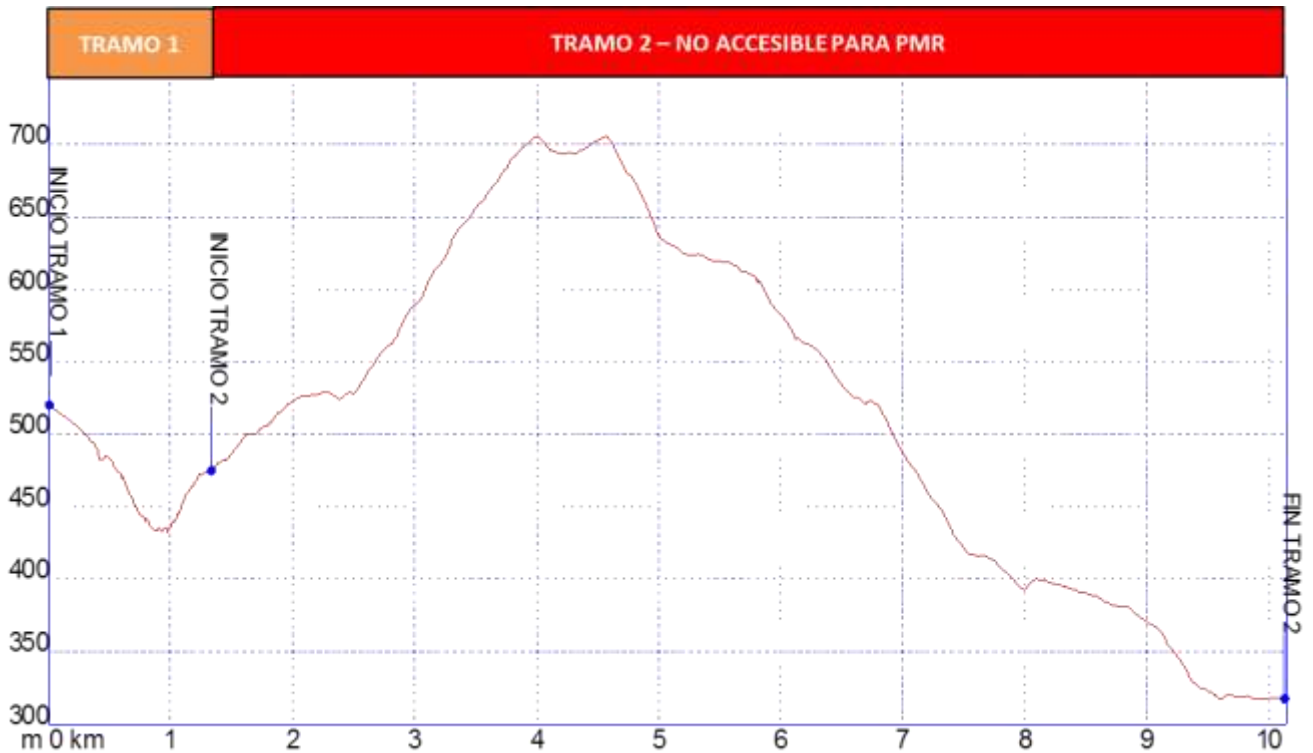
Gráfica 1: Identificación tramos etapa15, nivel de accesibilidad.

➤ PERFIL ETAPA15: Perfil de altitud e identificación por tramos.