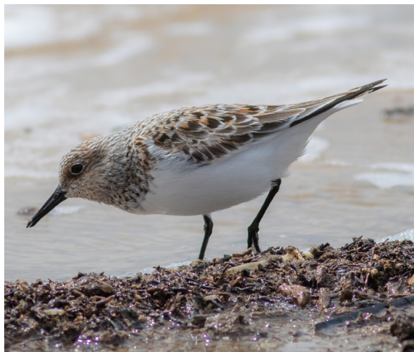
En paso migratorio