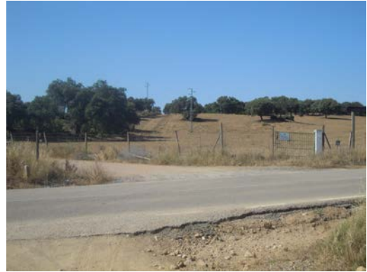
WPT10. Cruce con carretera A-7200