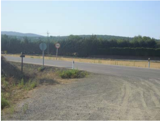
WPT15. Inicio de coincidencia 2 con carretera A-333