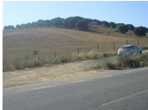
WPT14. Fin de coincidencia con carretera A-333