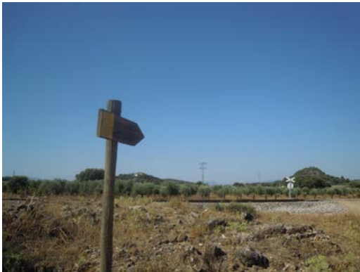
WPT11. Paso a nivel sin barrera e inicio de coincidencia con GR 249 Etapa 13