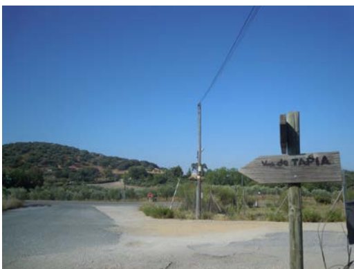
WPT13. Inicio de coincidencia con carretera A-333