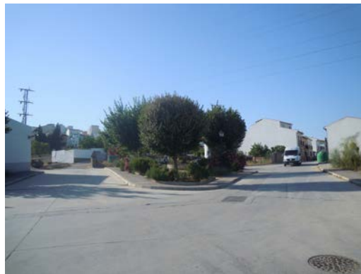
WPT17. Fin de etapa y de coincidencia con GR 249 Etapa 13