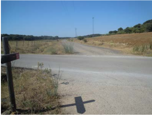
WPT9. Cruce por camino asfaltado con tráfico constante