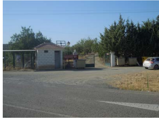
WPT16. Fin de coincidencia 2 con carretera A-333 e inicio de coincidencia 2 con GR 249 Etapa 13