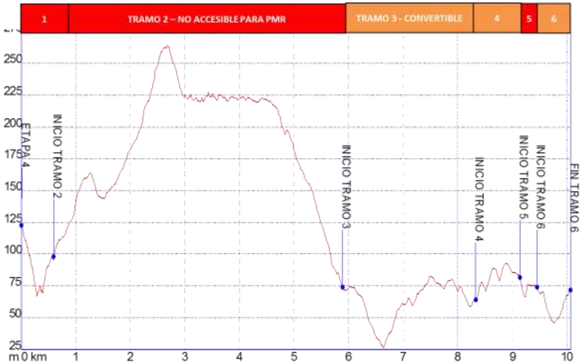
Gráfica I: Identificación tramos etapa 4, nivel de accesibilidad.

➤ PERFIL ETAPA 4: Perfil de altitud e identificación por tramos.