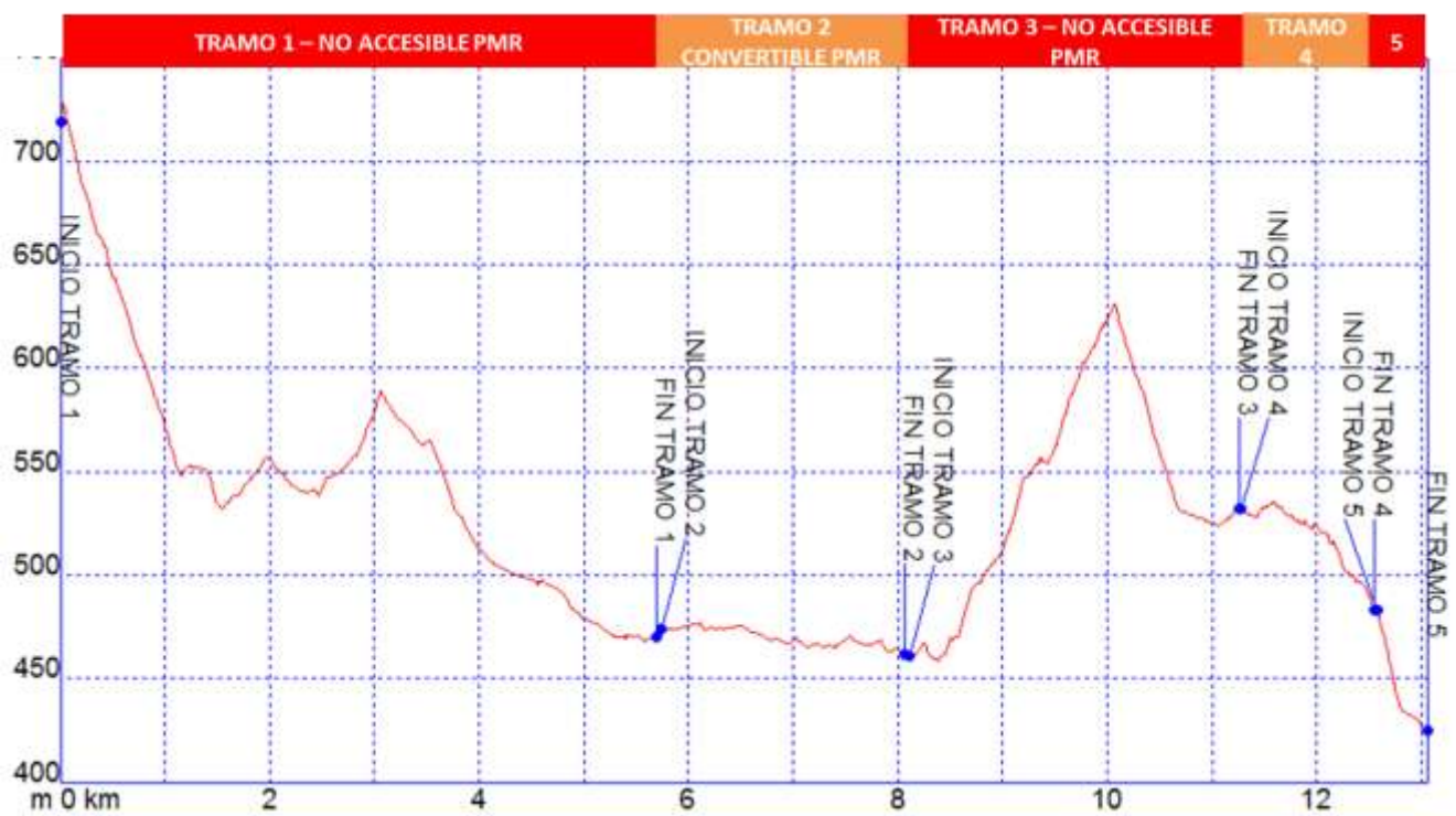
Gráfica I: Identificación tramos etapa 24, nivel de accesibilidad.

➤ PERFIL ETAPA 24: Perfil de altitud e identificación por tramos.