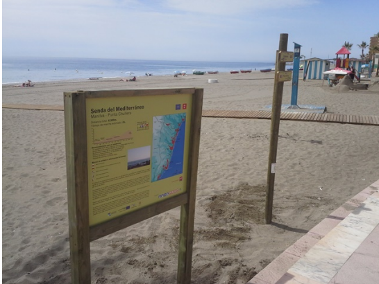
WPT1. Inicio de etapa y enlace con GR 92 E-12 Etapa Estepona - Manilva