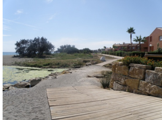
WPT2. Cruce arroyo Indiano