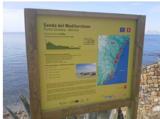
WPT4. Fin de etapa