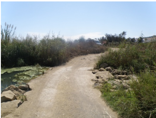
WPT3. Cruce de arroyo Alcorín