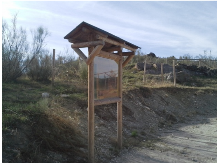
WPT1. Inicio y fin de sendero