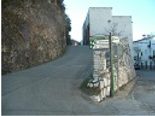
WPT1. Inicio y fin de sendero