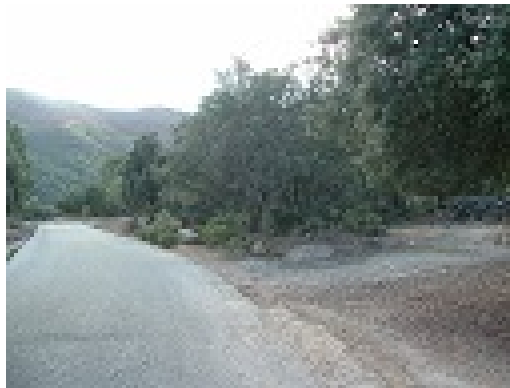
WPT3. Fin de tramo común con carretera