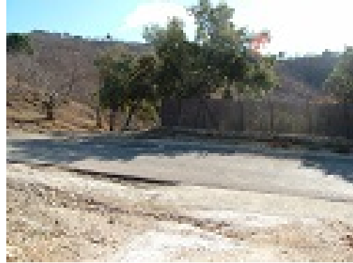
WPT2. Inicio tramo de carretera