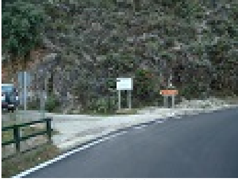
WPT1. Inicio sendero