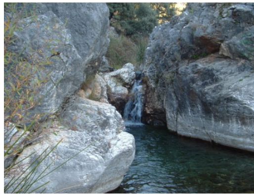
WPT3. Fin sendero