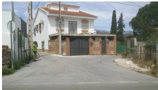
WPT11. Fin de etapa y enlace con GR 243 Etapa 5 y PR-A 279