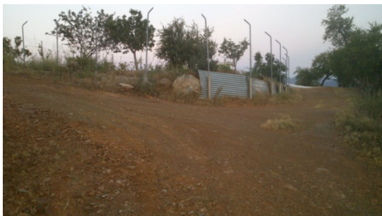
WPT5. Cruce sin señal