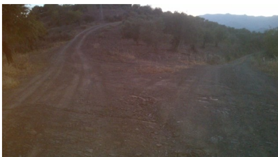
WPT7. Cruce sin señal