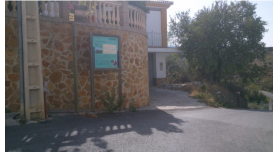
WPT10. Fin de coincidencia con PR-A 274