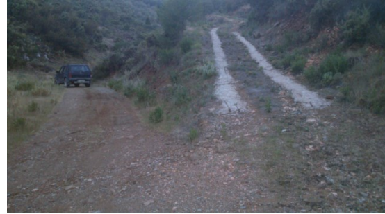
WPT2. Cruce sin señal