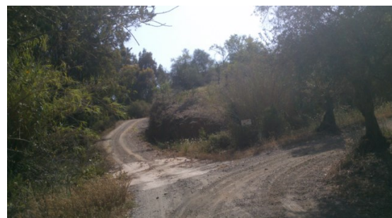
WPT8. Enlace con la vuelta del PR-A 274 (circular)