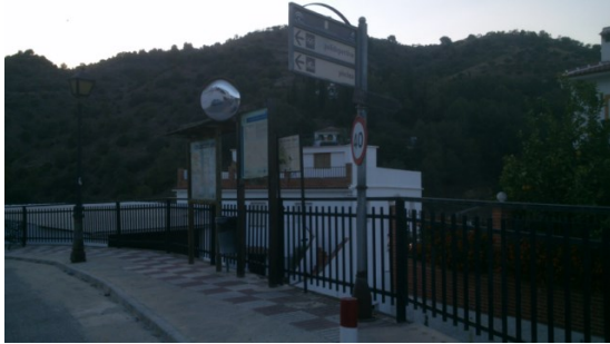
WPT1. Inicio de etapa