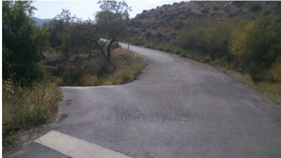
WPT9. Cruce sin señal