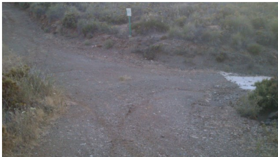
WPT3. Inicio de coincidencia con PR-A 279