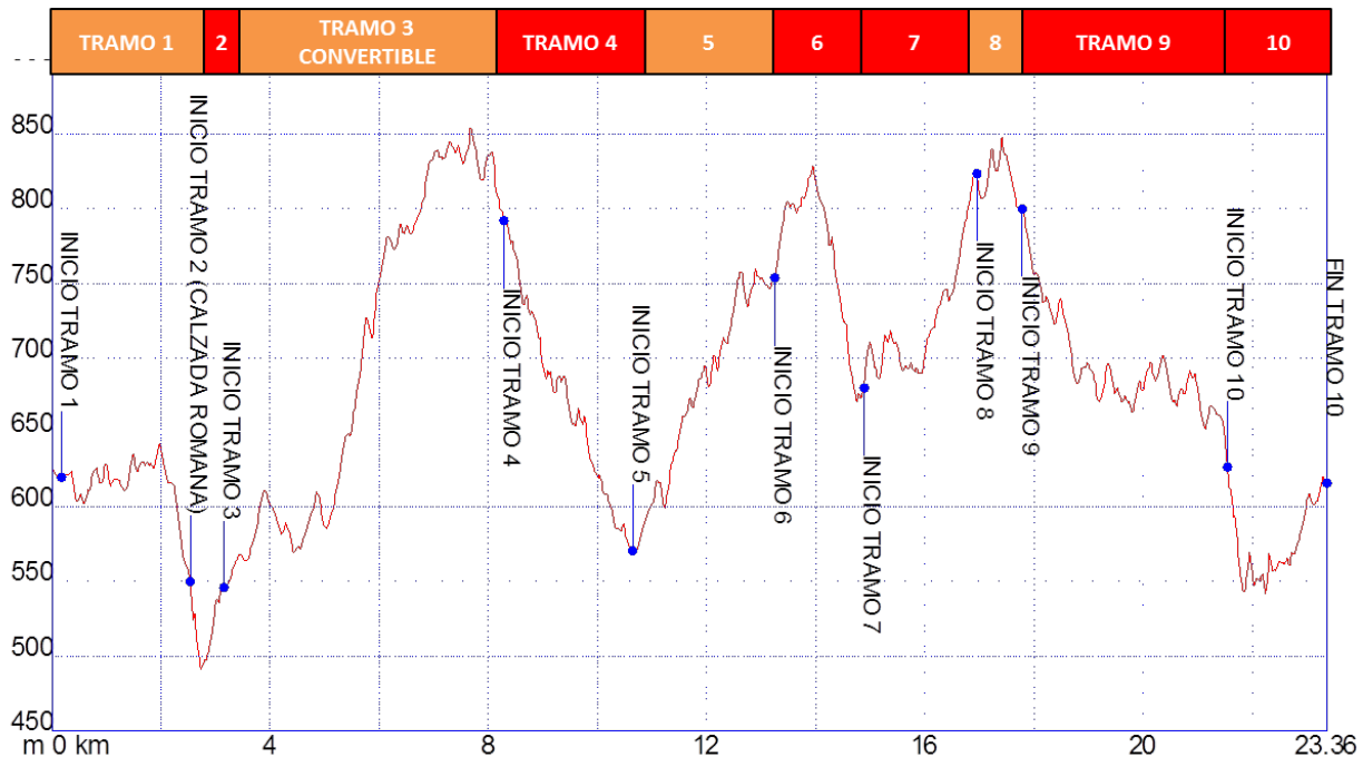
Gráfica 1: Identificación tramos etapa7, nivel de accesibilidad.

Los tramos que se han identificado en la etapa 7Cómpeeta-Canillas de Aceituno para personas con movilidad reducida son los siguientes: