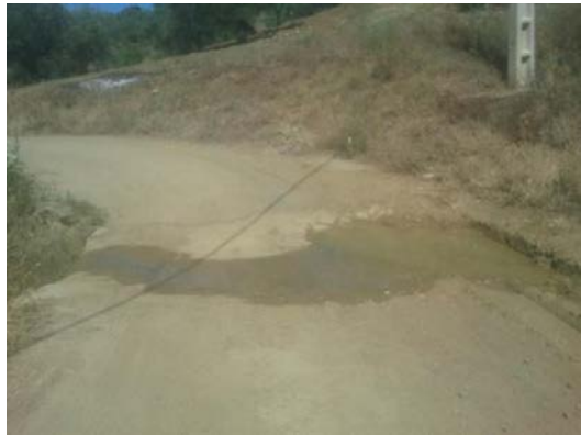
WPT4. Arroyo de las Morenas