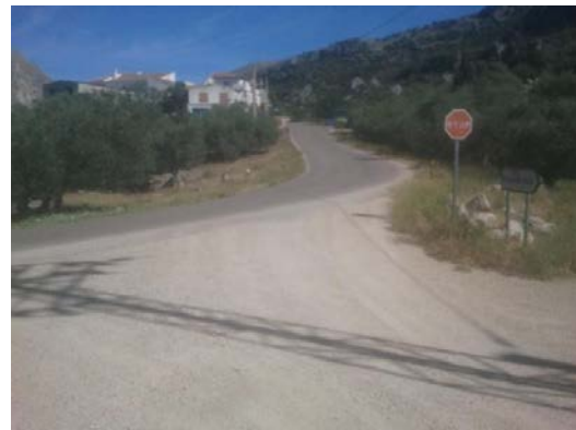
WPT10. Fin de coincidencia con GR 249 Etapa 10 y con carretera MA-157. Inicio de coincidencia con GR 249 Etapa 9