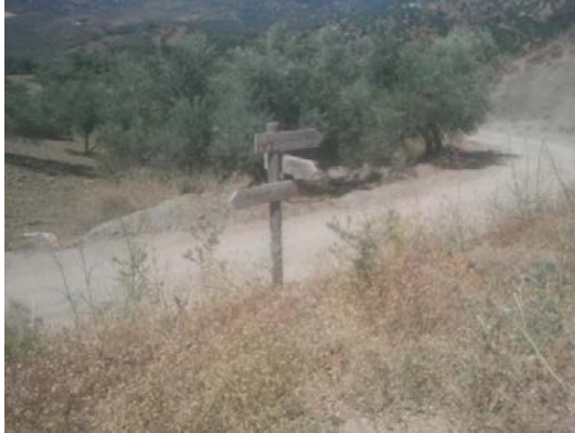
WPT1. Inicio de etapa y enlace con GR 7 E-4 Etapa 1S