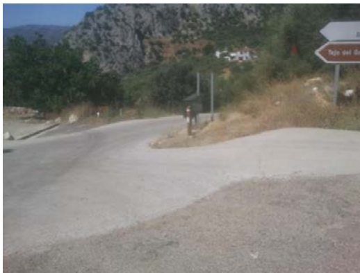
WPT9. Inicio carretera MA-157