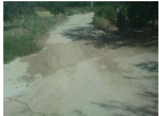
WPT6. Arroyo de las Morenas