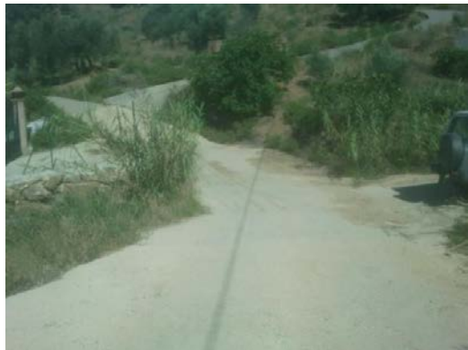
WPT5. Arroyo de las Morenas