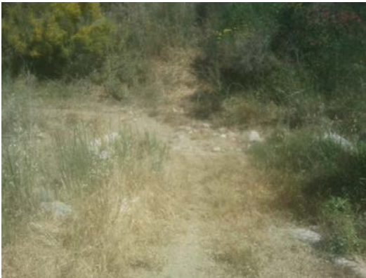
WPT3. Arroyo de Auta