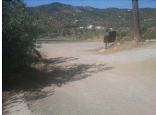
WPT8. Fin carretera A-7204