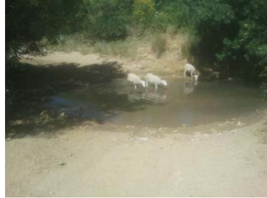
WPT2. Río de la Cueva e inicio de coincidencia con GR 249 Etapa 10