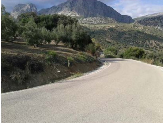
WPT7. Puerto Sabar, inicio carretera A-7204