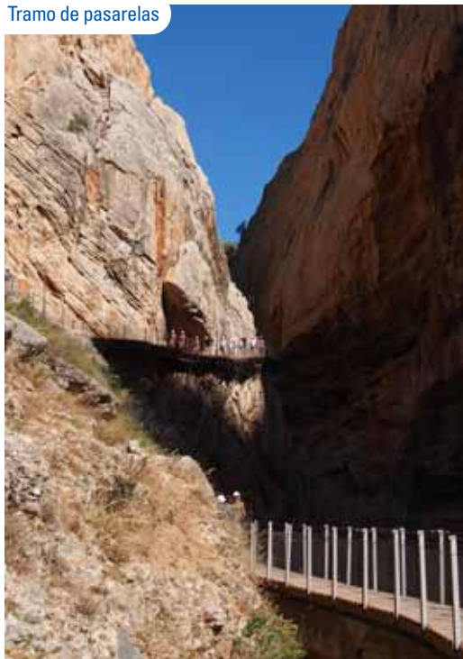
Tramo de pasarelas

Después de un corto trayecto por el interior del canal, accedemos al desfiladero de los Gaitanes, donde se alcanzan alturas superiores a los 250 m de caída vertical. Al ver el trazado del tren en este sector del cañón, se comprende la magnitud y dificultad de las obras. Por otra parte, estas paredes son un excelente muestrario de pliegues tectónicos, estructuras sedimentarias y estratos a los que se suman los moldes de ammonites que delatan el origen