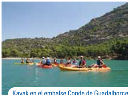
Kayak en el embalse Conde de Guadalhorce

cortados, donde conviven los amantes de la escalada (actividad deportiva regulada según criterios de protección), con el buitre leonado ( Gyps fulvus ), el águila-azor perdicera ( Aquila fasciata ) y el águila real ( Aquila chrysaetos ). Por otra parte, los embalses, además de su empleo para abastecer el consumo humano, los regadíos y generar energía eléctrica, cumplen una importante función recreativa. La actividad de la pesca deportiva ha propiciado la introducción de especies alóctonas, es el caso de carpa ( Cyprinus carpio ), el pez sol ( Leponis gibbosus ) y el lucio ( Essox lucius ).