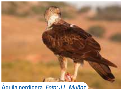
Águila perdicera.