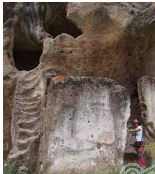
Vivienda mozárabe. Casa de la Reina Mora

No podemos dejar la oportunidad de conocer el yacimiento arqueológico de Bobastro , correspondiente con una ciudad mozárabe, sede del rebelde Omar Ben Hafsún, líder de una revuelta contra el Emirato de Córdoba. La ciudad de Bobastro tiene la particularidad de estar excavada en parte sobre las rocas de areniscas. De sus ruinas destaca la iglesia rupestre, de traza basilical, con tres naves y ábsides y un crucero. En la zona también se ven restos de murallas, silos, aljibes y canteras de sillares y numerosas tumbas antropomorfas. Tiene acceso a través de la carretera MA-448, la cual se deriva de la MA-5403 (Ardales-El Chorro). Junto al acceso hallamos una caseta de información. Existe la posibilidad de realizar la visita con guía. ■