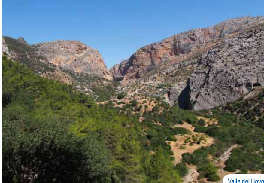
Valle del Hoyo

marino de la roca. En este trayecto se ha habilitado un pequeño balcón con suelo transparente, pero el punto de mayor vértigo lo viviremos al cruzar el puente colgante junto al acueducto. Acaban las pasarelas en el camino que nos llevará hasta la barriada de El Chorro. Desde este vial vislumbraremos el embalse del Tajo de la Encantada Inferior y el tubo que eleva las aguas al embalse superior, situado en la mesa de Villaverde, lugar donde se ubica el yacimiento arqueológico de Bobastro. Antes de finalizar el recorrido veremos el imponente viaducto de los Albercones solventar la cañada del Sabucón.