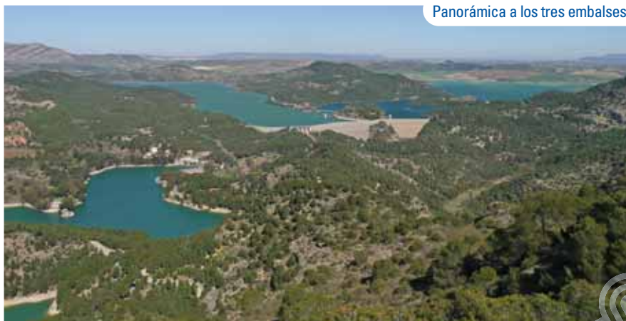
Panorámica a los tres embalses

Desgraciadamente, estos pantanos no se han librado de la aparición del mejillón cebra ( Dreissena polymorpha ), un bivalvo originario de los mares Negro y Caspio que provoca importantes alteraciones en el equilibrio ecológico. La creación artificial de los embalses ha supuesto un auge importante para las aves acuáticas, sobre todo en las colas de los embalses, donde podremos observar al cormorán ( Phalacrocorax carbo ), al pato cuchara ( Anas clypeata ), a la garza real ( Ardea cinerea ) y a las gaviotas patiamarilla y reidora ( Larus michahellis y L. Chroicocephalus ).