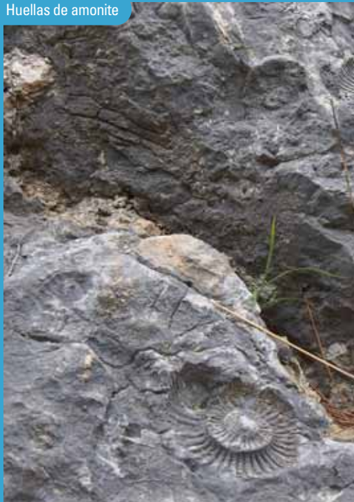
Huellas de amonite

El recorrido no es apto para personas que sufran vértigo o padezcan alguna enfermedad coronaria o respiratoria; tampoco para las sujetas a tratamiento médico. Se requiere un nivel físico aceptable. La concesionaria proporciona un casco de seguridad a cada usuario en el punto de inicio del tramo sujeto a regulación. Posteriormente, se devuelve en la caseta de control situada junto al núcleo poblacional de El Chorro.