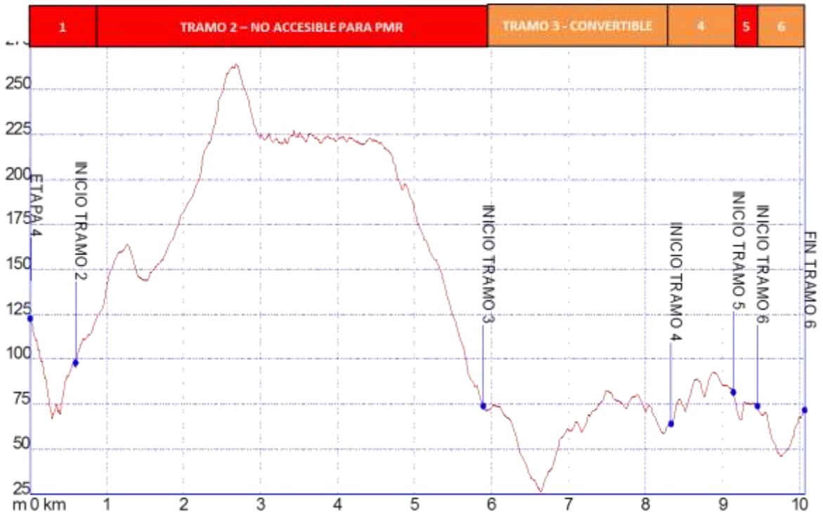
Gráfica 1: Identificación tramos etapa4, nivel de accesibilidad.

➤ PERFIL ETAPA4: Perfil de altitud e identificación por tramos.