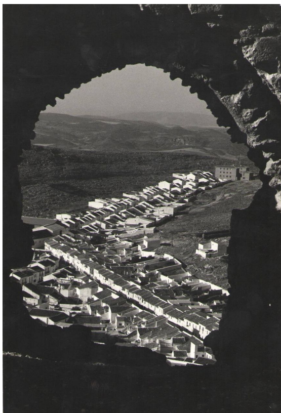
Fotografía realizada desde el Castillo de la Estrella entorno a 1970