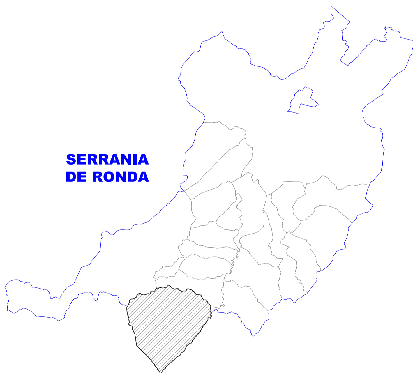
SITUACIÓN DENTRO DE LA COMARCA Comarca de La Sierra de las Nieves