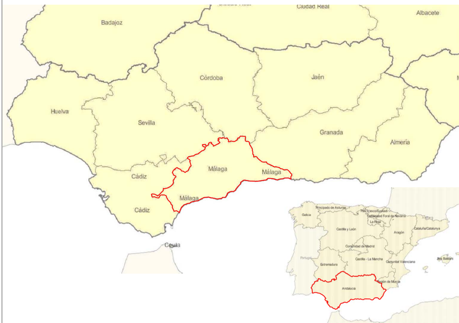
SITUACIÓN DENTRO DE LA COMUNIDAD