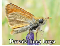
Hespérie de la houque