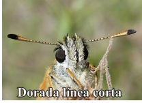
Hespérie du dactyle

Hespérie du dactyle : confusion possible seulement lorsqu'il est fermé, les pointes des antennes sont noires. Hespérie de la houque : confusion possible seulement lorsqu'il est fermé, mais son aile postérieure a un ton paille. Comma : il est plus grand et robuste ; confusion possible seulement lorsqu'il est ouvert, mais il présente moins de points et ils ne forment pas d'arc. Sylvaine : il est plus grand et robuste ; confusion possible seulement les ailes ouvertes, mais il a moins de points et ceux-ci ne forme pas d'arc ; en outre, la ligne noire (androconie) est plus grande et le marron est moins présent chez les deux sexes.