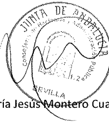
D a . María Jesús Montero Cuadrado