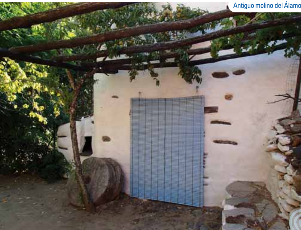
Antiguo molino del Álamo

myrtifolia ), jaboneras ( Saponaria officinalis ) y el hermoso acanto ( Acanthus mollis ) que halla en estas umbrías uno de sus rincones preferidos en el Valle del Genal. En el tramo final nos esperan la última pasarela y una densa chopera, al final de la cual, a la izquierda, sube la vereda de los Limones hacia Genalguacil. Este es el punto donde se dirimen el GR-249 a dicha población y el GR-141 a Benarrabá. No obstante, avanzamos rectos unos metros entre cañas ( Arundo donax ) y tarajes ( Tamarix africana ), por la misma ribera del Genal, hasta alcanzar casi de inmediato la amplia vega de la Escribana, enclave donde finaliza la ruta.