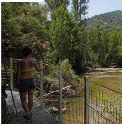
Pasarelas del Genal

Solanas, umbrías y las riberas del Genal son las tres caras de las vertientes del Genal, dos mundos enfrentados a un lado y otro del hilo hídrico, fácilmente reconocibles a ojos del profano por los distintos usos