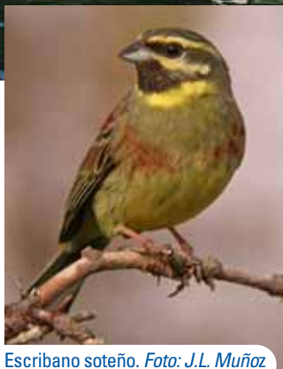
Escribano soteño.