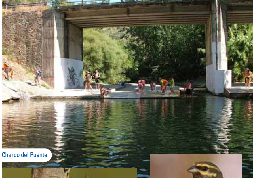
Charco del Puente