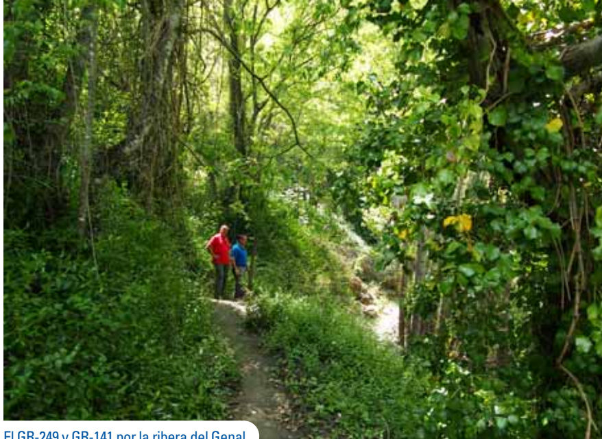
El GR-249 y GR-141 por la ribera del Genal

agropecuarios a los que se ven o fueron sujetos. Las laderas expuestas al mediodía son vocacionalmente las mejores para los cultivos leñosos: almendros, olivos, nogales, cerezos y viñas que conviven yuxtapuestas a manchas de encinar y pinar. En la banda de umbría prepondera el alcornoque, extendido por todo el entorno y muy bien adaptado a cualquier requerimiento litológico o climático. En tanto, en las vaguadas cerradas y gargantas prepondera el quejigo, aunque el rey de la foresta en estos ambientes, aun siendo un cultivo, es el castaño, fagácea que aporta gran personalidad al paisaje del Valle del Genal y buenos tributos a las economías locales. La crisis irreversible de la vida campesina en la montaña mediterránea tiene su mejor espejo en las vegas ribereñas. Donde antes lucían veredas, ranchos, ventorros, molinos hidráulicos, tenerías, huertas, hornos y caleras, hoy todo lo invade el vigoroso bosque en galería o el cultivo del chopo.